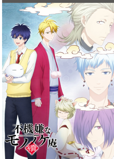
Fukigen na Mononokean: Tsuzuki