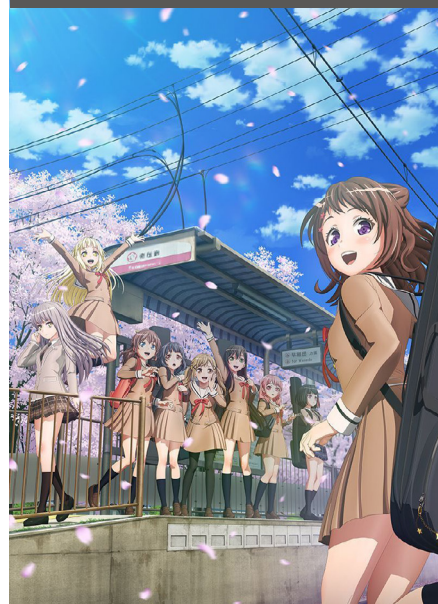
BanG Dream! 2