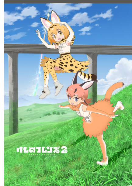
Kemono Friends 2