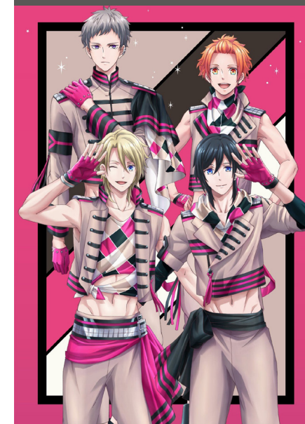
B-Project: Zecchou * Emotion