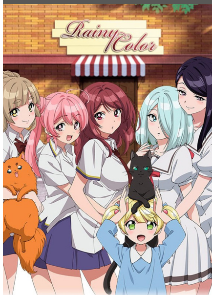
Ame-iro Cocoa: Side G