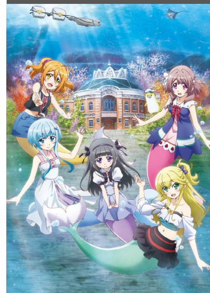
Bermuda Triangle: Colorful Pastrale