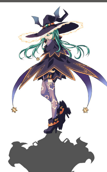
Date A Live III