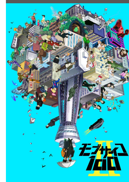
Mob Psycho 100 II