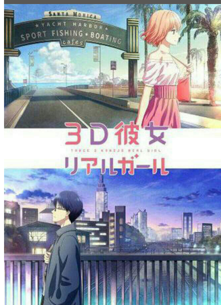
3D Kanojo: Real Girl 2