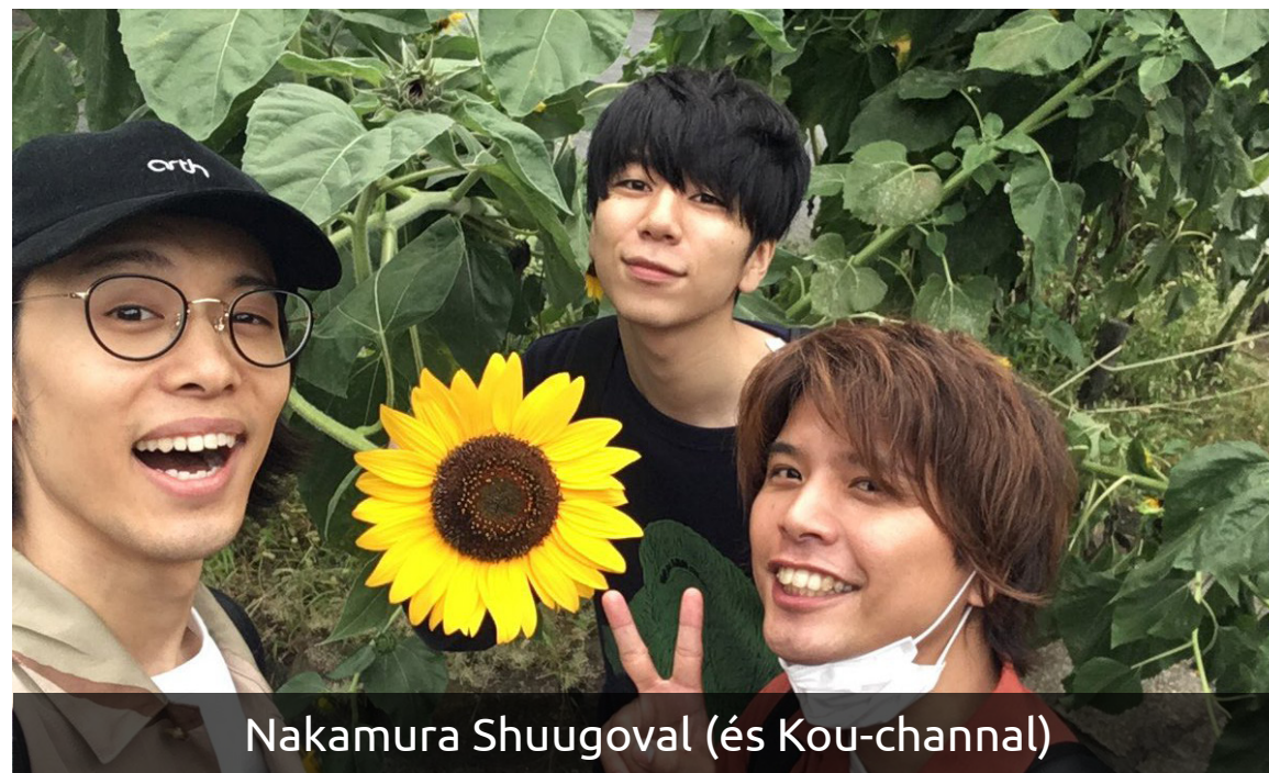
Nakamura Shuugoval (és Kou-channal)