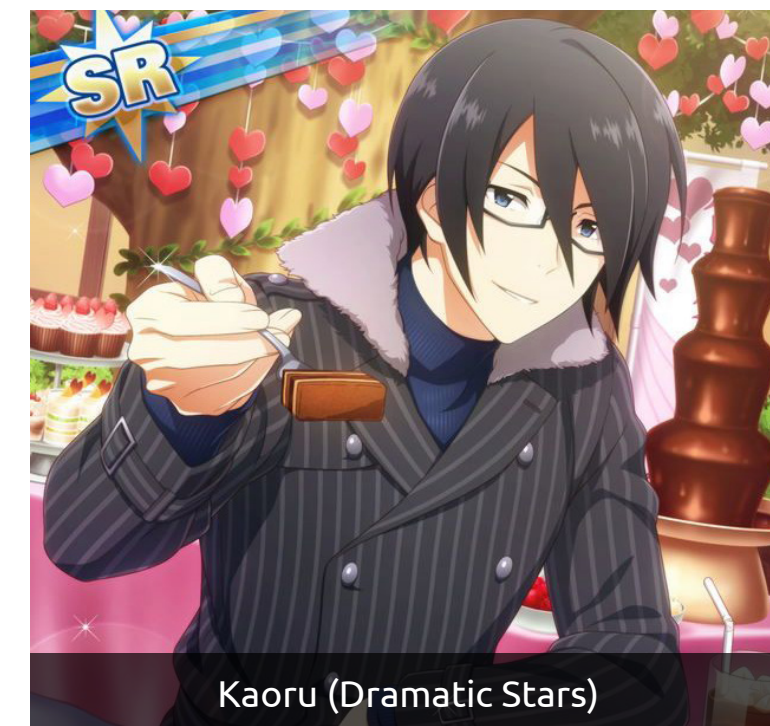
Kaoru (Dramatic Stars)

Fontos szerep jutott neki a nagy sikerű ReLIFE című romantikus seinen animében, ahol Ogou Kazuomit személyesíti meg. A történet az újratekintéssel foglalkozik, hiszen főszereplőnk, Kaizaki Arata egy munkahelyi traumát követően a társadalom peremére szorult.