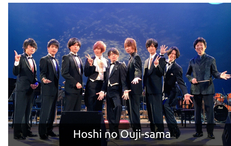
Hoshi no Uji-sama