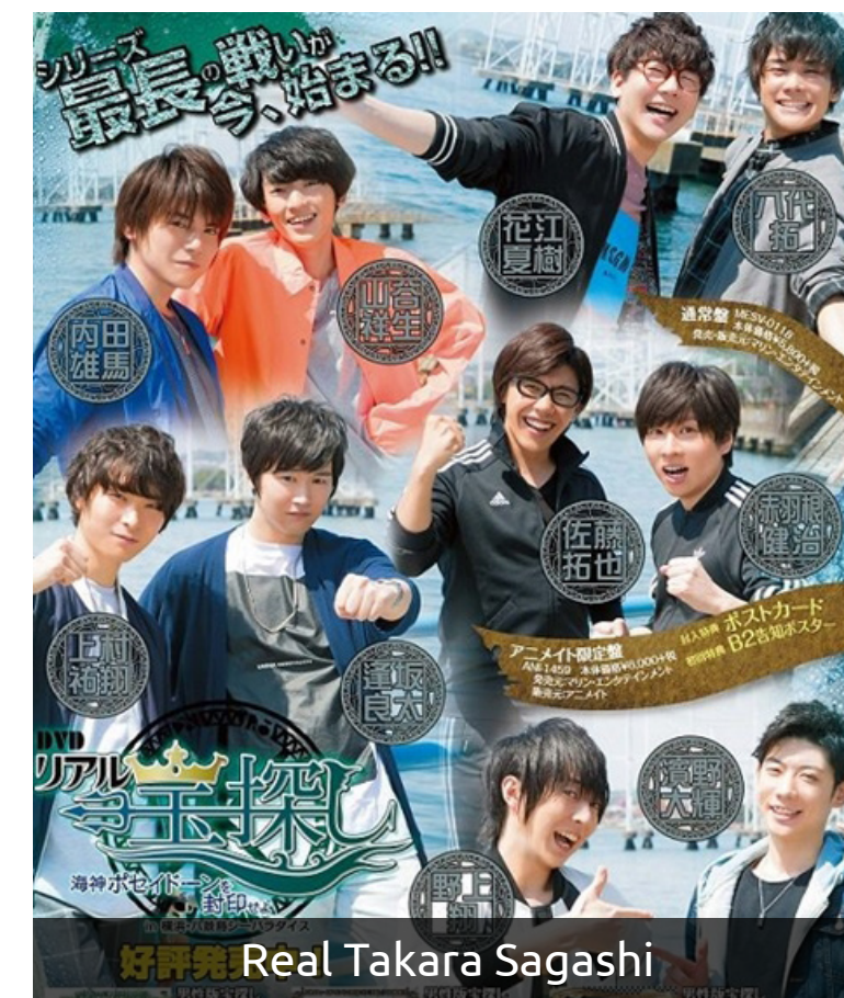
好評発売! Real Takara Sagashi