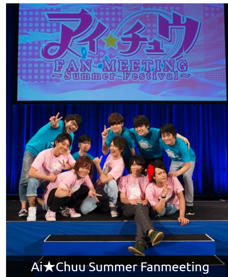
Ai★Chuu Summer Fanmeeting