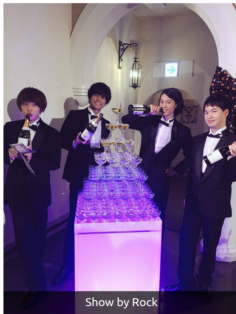
Show by Rock

használókat várja, akik kiábrándultak a valóságból. Azonban néhány lakó, a Hazajárók Klubjának tagjai felfedezik a turpisságot és megpróbálnak visszatérni a saját valóságukba, míg mások inkább maradnának a számukra tökéletes helyen. Chiharu Shikishima Ritsut alakítja. A fiú egy különösen intelligens, gyors észjárású fiatalember, aki szívesen olvas az emberi lélekről és pszichéről, így viszonylag hamar észreveszi, hogy valami nem stimmel, ezzel pedig az események sűrűjébe csöppen. A seiyuu ezzel a sorozattal kapcsolatban a Crunchyrollnak adott interjúban mesélt arról, hogy egészen más volt az anime és a játék felvétele. A játékban ugyan ő beszélt, de a játékos bújta a főhős bőrébe, míg az animében Ritsu saját karaktert kapott. Mivel a karaktere egy tájékozott zseni, a szöveggönyvben sűrűn találkozott olyan szakszavakkal és kifejezésekkel, amiknek utána kellett néznie az interneten vagy könyvekben a felvételek előtt.