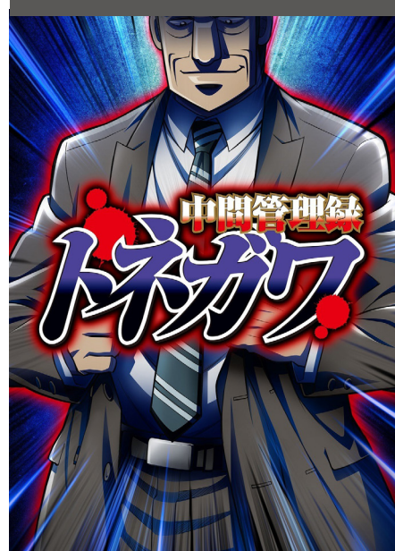
Chuukan Kanriroku Tonegawa