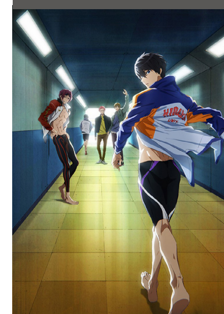
Free! Dive to the Future