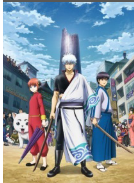
Gintama. Gin no Tamashii-hen 2