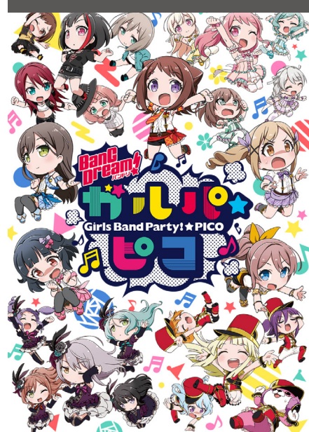
BanG Dream! Garupa☆Pico