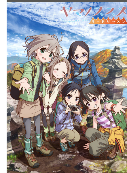
Yama no Susume 3