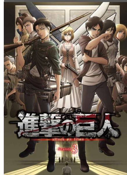
Shingeki no Kyojin 3