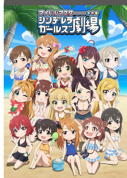
Cinderella Girls Gekijou 3