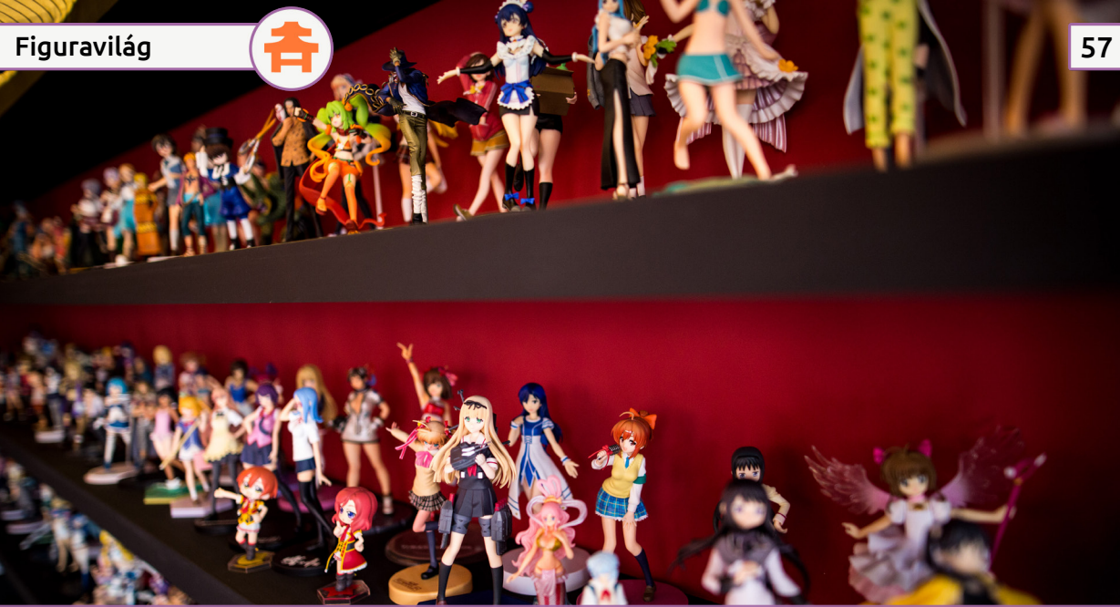
Figura vásárlás: Milyet, honnan?