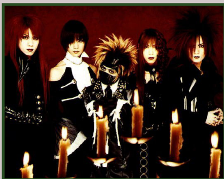
Képen: Dir en Grey

Nem elég, hogy egymás után tűntek el a számtalan rajongóval rendelkező együttesek, a kiadók némelyike is erre a sorsra jutott. Jó példa erre a Key Party csődbe jutása. Ezt gyakorlatilag egyetlen általuk támogatott csapat élte túl, a Crow, ami Kagrra néven ma is fut, és nagy-