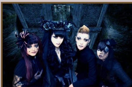
Képen: Velvet Eden

független kiadókhöz, de saját elképzelés szerint dolgozhatnak ( Malice Mizer , Dir en Grey ), vagy maradnak a nagyobb kiadónál, de nem fejlesztik tovább a műfajt ( Plastic Tree ). 2001-ben – a hatalmas sikerek ellenére – bekövetkezett a visual kei történetének