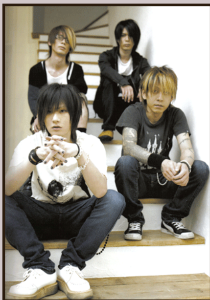
Képen: Plastic Tree

Nem elég, hogy egymás után tűntek el a számtalan rajongóval rendelkező együttesek, a kiadók némelyike is erre a sorsra jutott. Jó példa erre a Key Party csődbe jutása. Ezt gyakorlatilag egyetlen általuk támogatott csapat élte túl, a Crow, ami Kagrra néven ma is fut, és nagy-