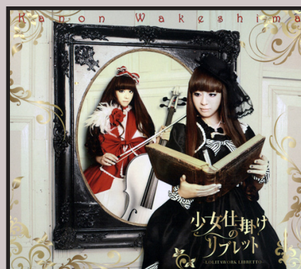
Képen: Kanon Wakeshima Goth Loli énekes

napig jellegzetes, lenyűgöző gitárszólókkal, és a refrén gyakori kihagyásával tették egyedivé. A sok csalódás ellenére a visual kei rajongóinak száma nemhogy csökkent volna, de folyamatosan gyarapodott. Egy nagyon különös/különleges, már-már misztikus szubkultúrává nőtte ki magát. Külön érdekesség még, hogy a rajongók körében elterjedt a cosplay, mikor is a fanok beöltöznek kedvenc zenészükhöz. A cosplay szerelmeseinek dolgát megkönnyítendő rájuk specializálódott üzletek nyíl-