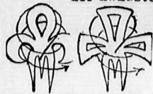
Dreitheiliger Kamm à fl. 1.50.

Moderne Frisur mit drei- theilig. Kamm ohne Daar- nadel zum Selbstfrisiren.