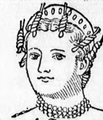
1 Stück Wellenwädeln fl. 1

Schopf-Mode-Frisur- stamm. Kleinste u. ge- eignet. Daarunterlage. fl. 1.20. — Ansicht d. eingebundenen Wellen- nadeln, um auf faltren Weg d. schönst. Wellen selbst zu erzeugen.