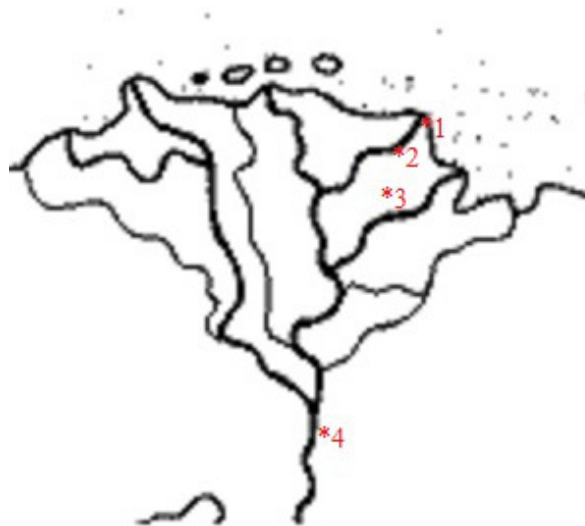
2. térkép. A Damiettaért folyó harc főbb helyszínei.

1. Jeruzsálem, 2. Damietta, a kézzel jelölt rész a Jeruzsálemi Királyság ekkori területét jelöli.