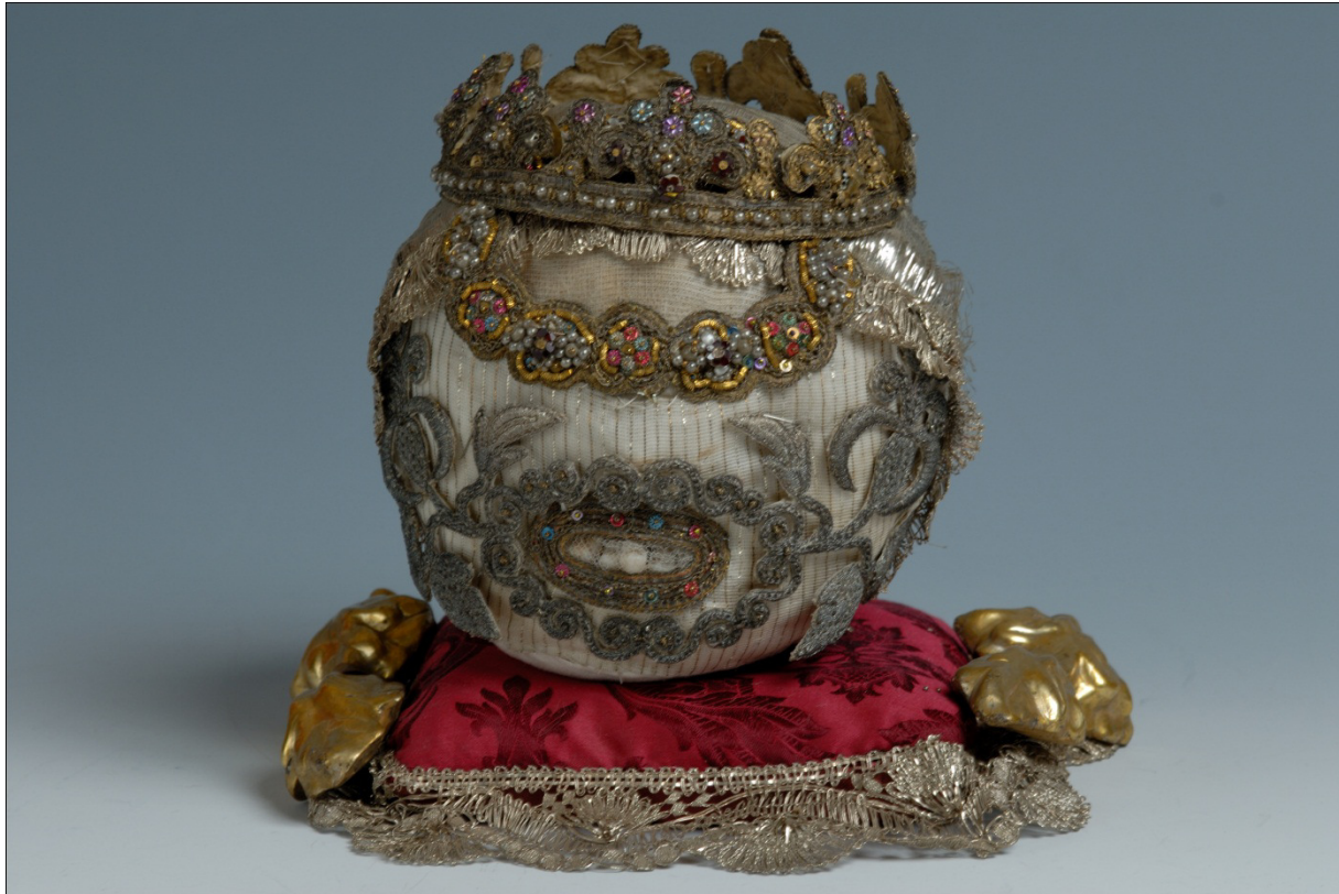
1. kép. Apácamunkával ékesített, feltételezett koponyaereklye. Díszítése: 18. sz. vége–19. sz. közepe. Leltári szám: Bazilika Gyarapodási Napló 21/2006, Esztergomi Bazilika.

hog az egész ereklyét eredetileg aranyozott ezüstszállal hímezték ki, de az aranyozás szinte mindenhol lekopott, s már csak egy helyen van nyoma.