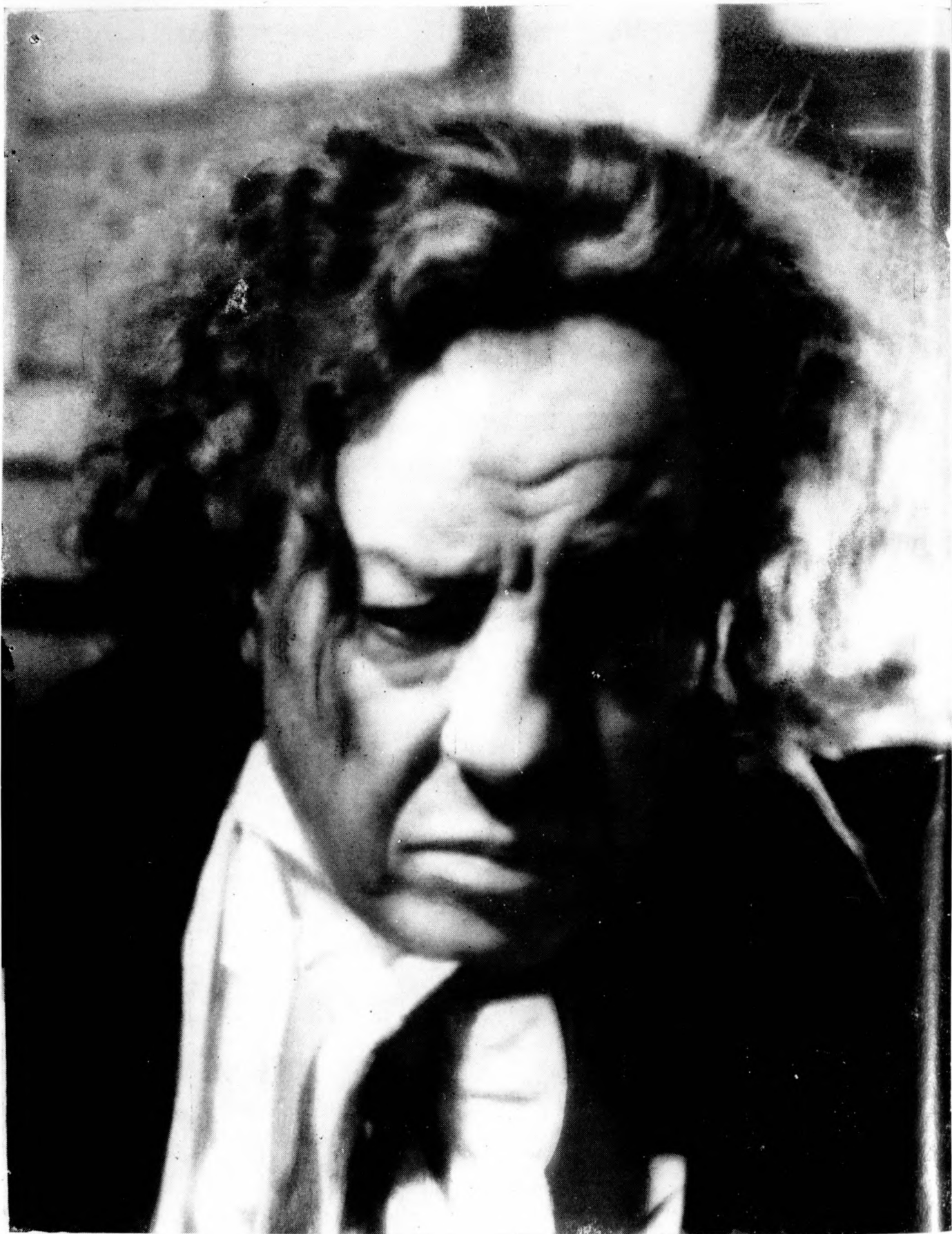
»Beethoven szerelme« (Vérző vágyak) Harry Baur monumentális filmszerepe