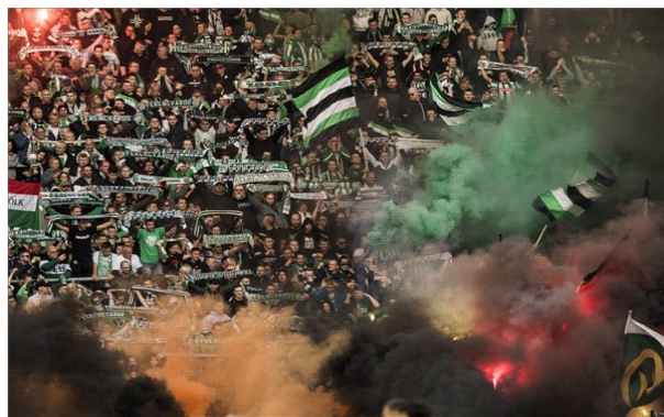
Visszatértek a Fradi ultrái a stadionba a Debrecen ellen

A Vasas és az Újpest is a középszőny második felében volt és egyik gárda sem gyűjtötte mostanában a pontokat. Kiegyenlített mezőnyjátékkal telt az első félidő, kevés gólszerzési lehetőséggel. A második félidőben a lilák aktívabban váltak és a félidő közepén megszerezték a vezetést is. A Vasast a gól sem rázta fel és továbbra is az Újpest akarata érvényesült. Az Újpest győzelmével közelebb került a középszőnyhöz.