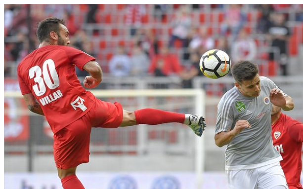
A Diósgyőr a Vasas fölé nőtt.

Kedden pótolták a 10. fordulónál félbeszakadt Vasas - Haladás mérkőzést. Az angyalföldiek a Diósgyőrtől hatalmas pontot kaptak, a Haladás pedig a bajnok Honvédtól kapott ki hazai pályán. Vagyis az előjelek sem itt, sem ott nem voltak túl jók. A jobb erőkből álló hazaiak hiába játszottak némileg fölényben, helyzeteket egyik oldalon sem nagyon tudtak kialakítani. A Vasas tovább küzdhet a dobogóért, a Haladás pedig továbbra is a kiesés elől menekül.