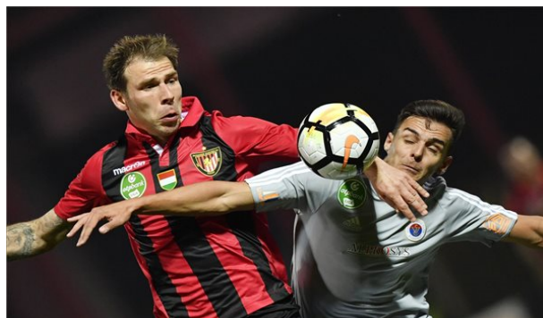
A Vasas legyőzte a bajnok Honvédot

A forduló rangadója a Honvéd-Vasas találkozó volt. Jól kezdett a Honvéd, több helyzete is volt, de a Vasas meglepetésre megszerezte a vezetést. Továbbra is támadásban maradt a Honvéd, de minden helyzetet kihagytak. Szünet után két gyors góllal eldöntötte a mérkőzést a Vasas. Sikerült ugyan a szépítés a Honvédnak, de a hajrában az angyalföldiek voltak ismét eredményesek. A Honvéd rossz szériája tovább folytatódik, a Vasas pedig beírta pontszámában a kispestieket.