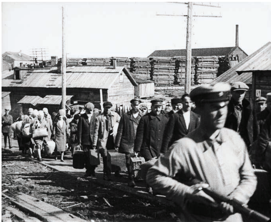
Foglyok útban a murmanskzi vasútállomásról a Fehér-tenger partján lévő Kemben található Szolovetszki Különleges Tábort továbbítottjába, 1927-1928

Mindezekén túl a korabeli Magyarországról történő elhurcolásoknál három jól elkülöníthető – de bizonyos esetekben keveredő – szempont is tetten érhető, így a tömegesen elhurcolt polgári személyek, vagyis a „málenkij robotosok” alapvetően három csoportba sorolhatók: 1.) hadifogolylétszámkiegészítés ; 2.) etnikai tisztogatás ; 3.) németként való internálás .