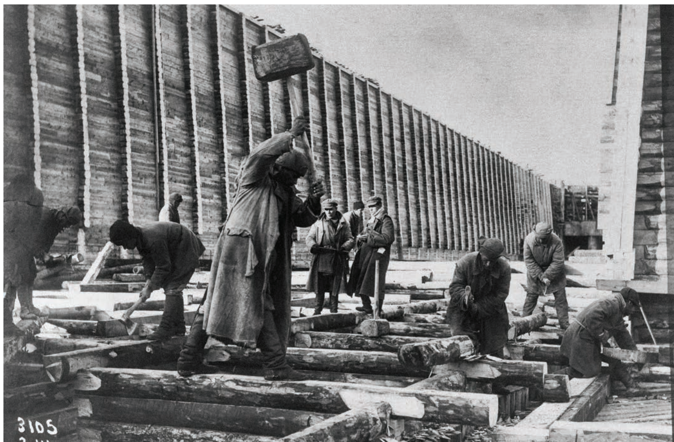
1 A szovjet „néphatalom” letéteményesei még 1935-ben törvényt hoztak a 12. életévüket betöltötték büntetethetőségéről: „A tizenkettedik életévüket betöltött kiskorúak... az összes büntető rendszabályok alkalmazásával ítéltetők.”

Zsilipek építése a Balti-Fehér-tengeri csatornán, 1931–1933 (Gulag-gyűjtemény, Tomasz Kizny)