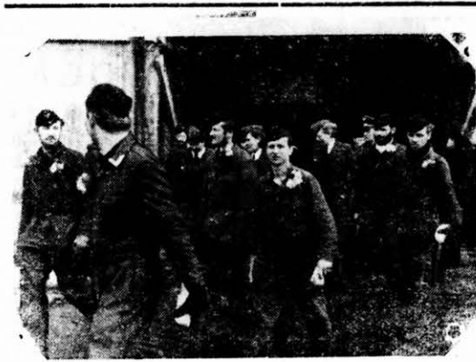
Egy német tengeralttjártó legénységé elhagyja a tengeralttjártót.

Glasi od torka: Japanski bombaši su pohodili na kineskoj fronti varaša Hungau i z bombami vužgali i vništili magazine, fabrike i železnice. Nazaj su došli prez svojega zgubička.