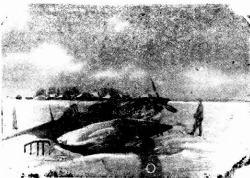
Egy leölt szovjet vadászrepülő.

(MN) Wayne C. Taylor amerikai kereskedelemügyi államtitkár legutóbbi beszédében utalt a kiskereskedelem fenyegető krízisére. A legtöbb kiskereskedő ezt nem veszi komolyan, mert egyelőre fogalma sincs a hamarosan bekövetkező forgalmi és bevételi veszteségekről, mivel ma még aránylag nagyok nevezhető készleteik elárúsításából élnek. Az árukészletek felrússítása pedig mind nagyobb nehézségekbe fog ütközni.