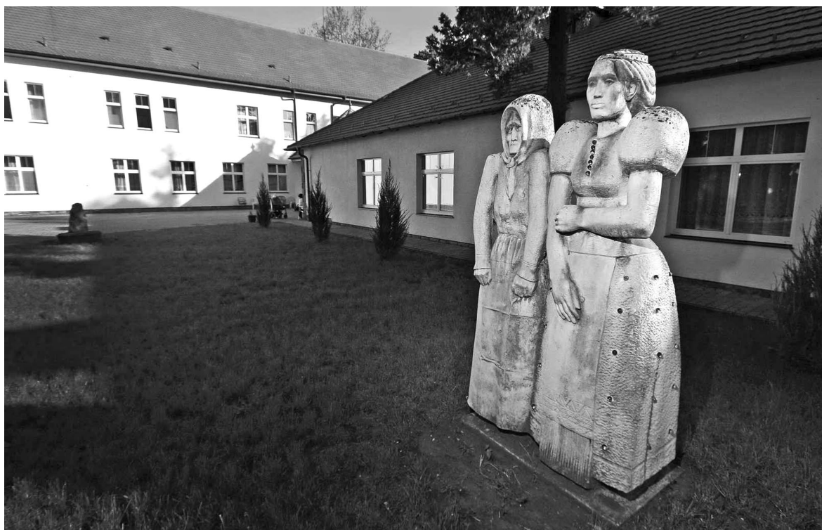
Ünnep (Heves, 1974, mészkő)