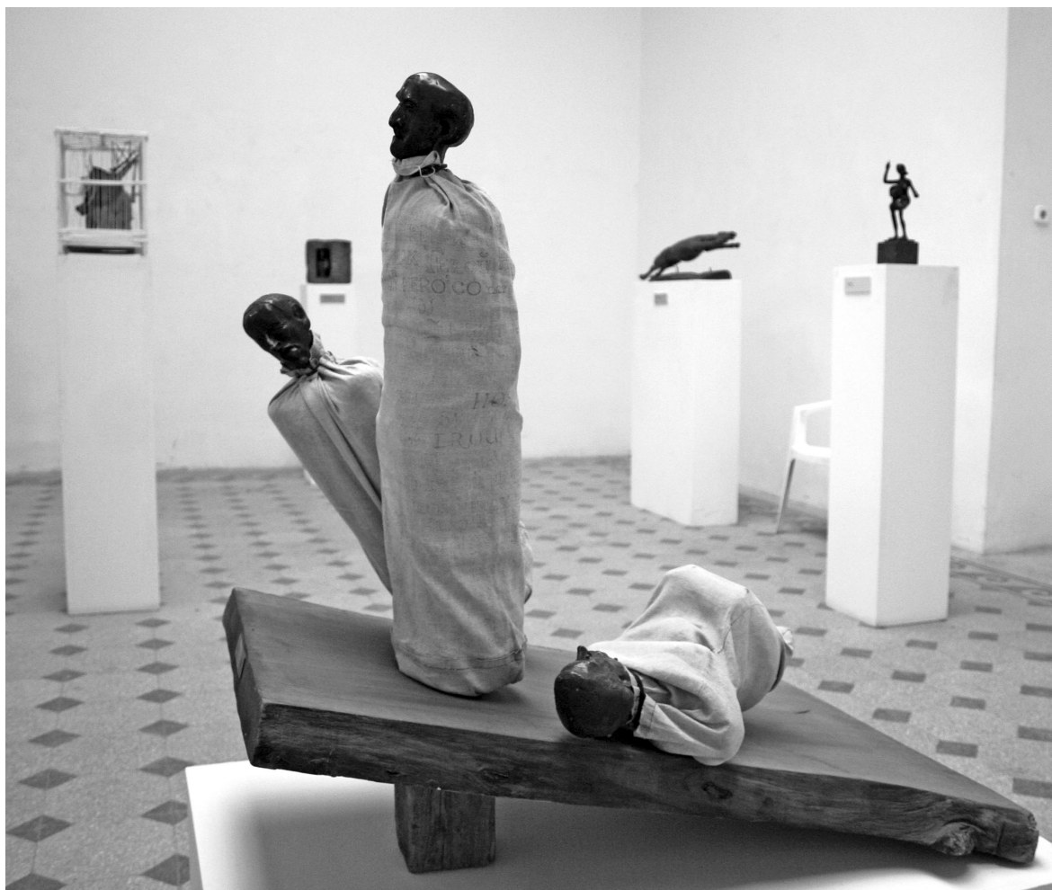
Verseny (háromalakos, 1982, bronz, vásznon)