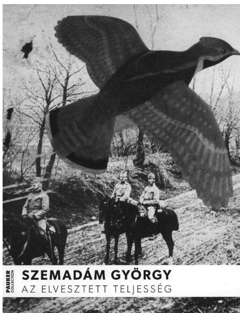
SZEMADÁM GYÖRGY AZ ELVESZETT TELJESSÉG