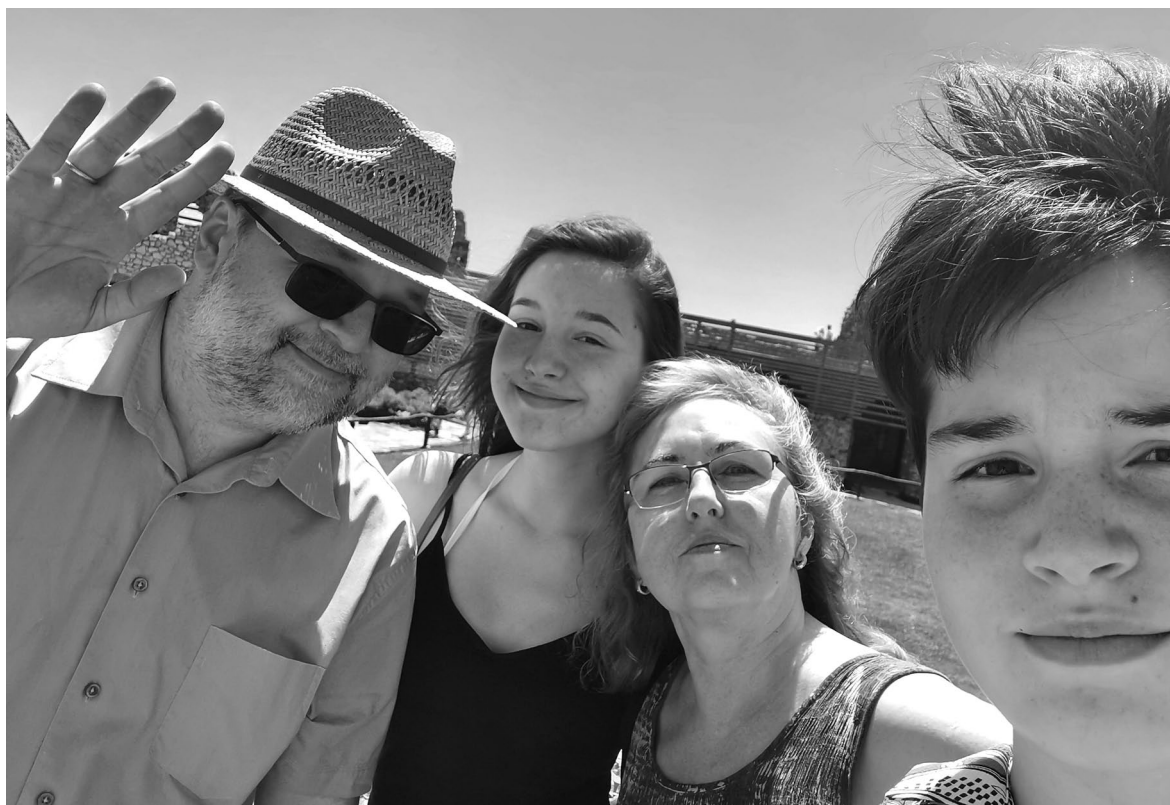
Családi nyaralás Sümegen (2019)

hetőséget megteremteni a szerző, a mű és a potenciális olvasó találkozására, azt megfelelően vonzó formában is kell tenni. Ha a könyvtáros például webes felületein rövid könyvismertetőket tesz közzé, minekelőtte tájékozódott a kortárs irodalom újdonságairól, új értékeiről, és ezeket ajánlja, az munkájának hatékonyságát meg tudja sokszorozni. Tehát a könyvtáros bizonyos értelemben kulturális tanácsadója is kell legyen a közönségnek. Annál is inkább így van ez, mert talán nem sokan tudják, hogy Magyarország legkiterjedtebb kulturális hálózata éppen a könyvtáraké. Könyvtár vagy könyvtári szolgáltató hely ma Magyarországon minden egyes településen van. Nyilvánvaló persze, hogy ezek különböző minőségben működnek, ez a minőség a fenntartó önkormányzat anyagi lehetőségeitől, de hozzáállásától, illetve a könyvtáros kollégák lelkes elhivatottságától – vagy annak hiányától – is függ. Az tény, hogy minden