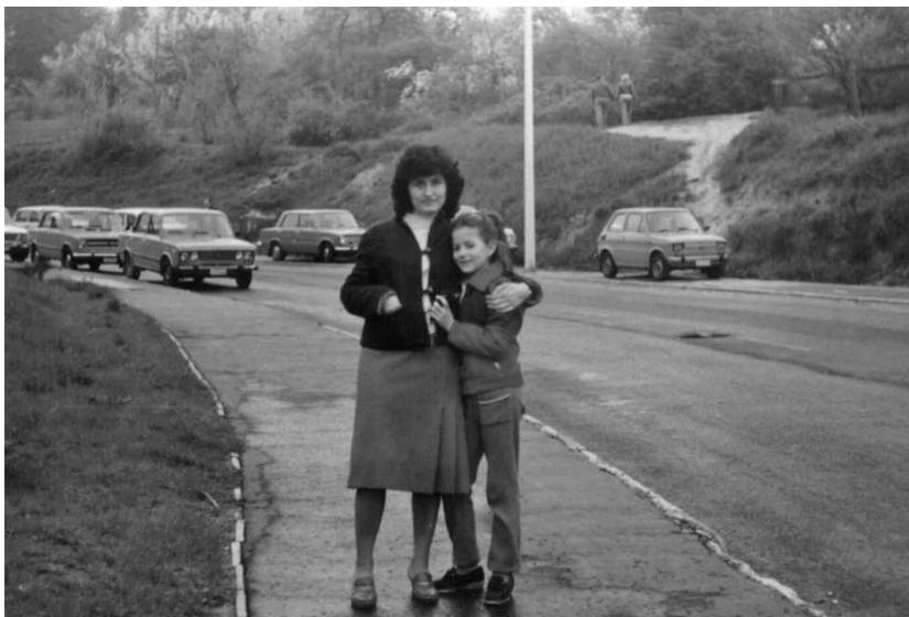
Anyukámmal a Thomán István utcában (1985)

– Amikor történészi pályámat kezdtem, még nem volt virtuális