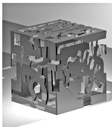
Vizuális terv (2013)