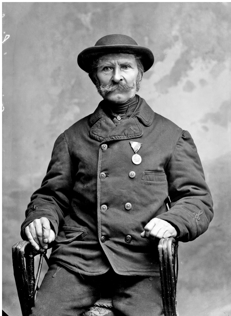
Diószegi Sándor (1832–1897) napszámos

később főszázadossá nevezték ki a 12. (Nádor) huszárezred tartalék századánál.