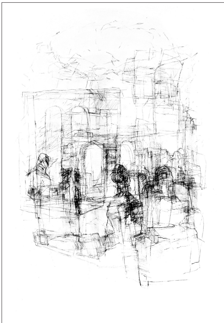
Barta János: Triptichon II. (litográfia, 100 × 70 cm)

A tanár az óra végén kérdéseket tesz fel a tanulóknak, hogy a mű eseményeit továbbgondolhassák, esetleg érdekességeket árul el a mű, illetve annak témája kapcsán.