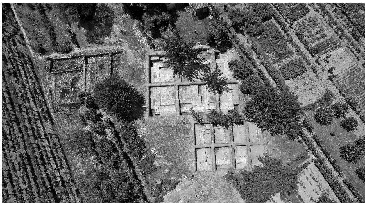
A Szulejmán-türbe ásatása felülnézetből