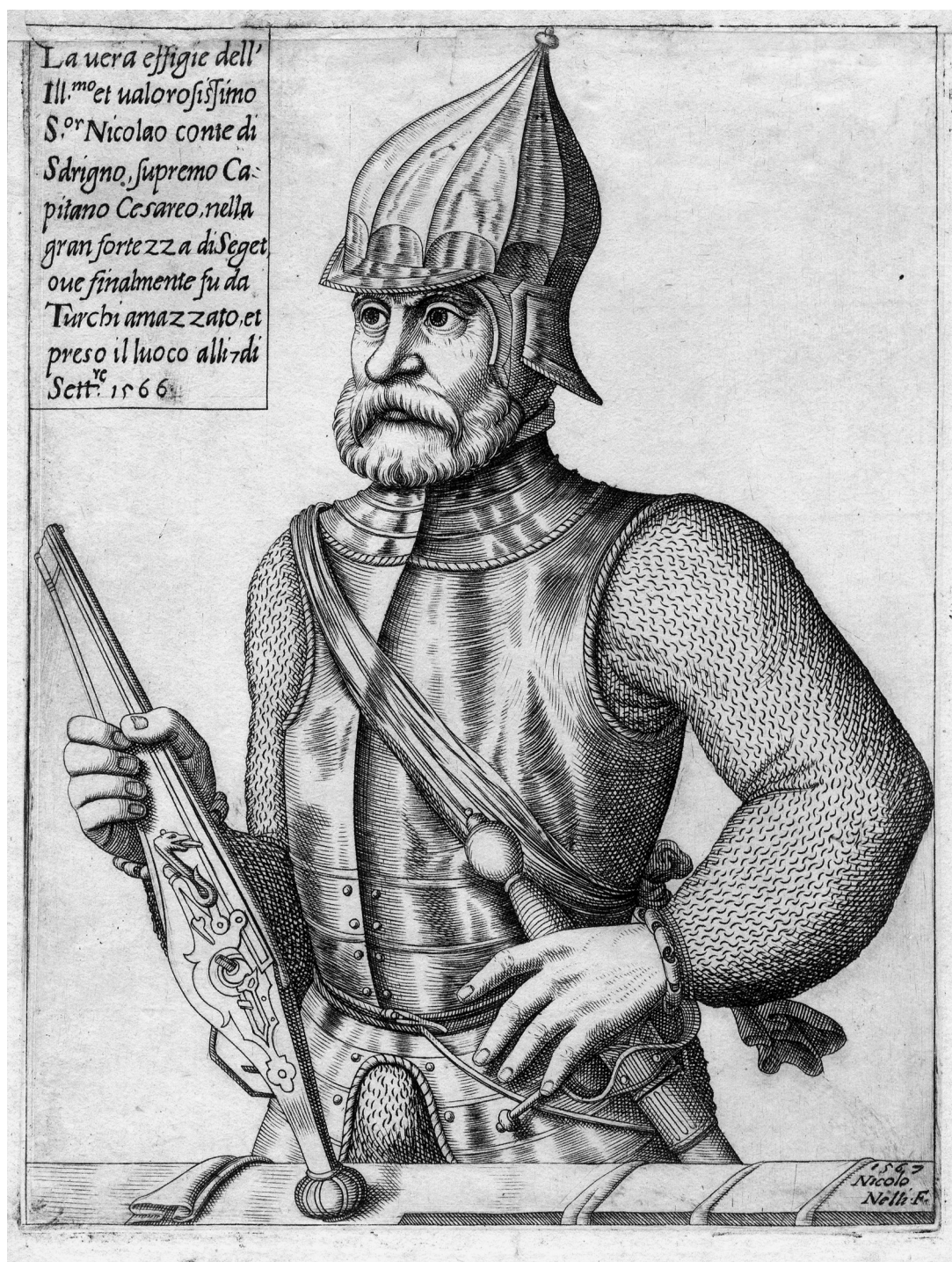
Niccolo Nelli: Zrínyi Miklós derékképe, papír, rézmetszet, 1567 (MNM, Történelmi Képcsarnok, fotó: Király Attila)

és magyar, sőt, osztrák és cseh állampolgár, minden zágrábi és csáktornyai, szigetvári és csurgói vagy éppen monyorókeréki lokálpatrióta. Egyszerre tarthatjuk tehát őt Horvát- és Magyarország, illetve az egykori Habsburg Monarchia, sőt, Közép-Európa közös hőségének.