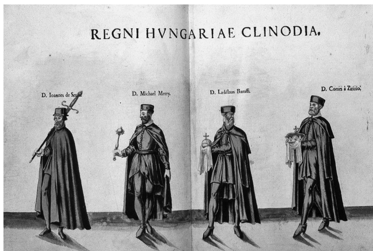
2. kép: Zrínyi Miklós a magyar Szent Korona másolatával I. Ferdinánd császár és magyar–cseh király bécsi gyászszerzésén, 1565. augusztus 6-án

Mindez összességében nem jelentett mást, minthogy Zrínyi Miklós élete végére a Magyar Királyság arisztokráciájának legfelső, aulikus rétegével került igen szoros kapcsolatba, míg közvetlen felmenői és leánytestvérei még csupán a horvát és a szlavón nemesi elit tagjaival (Karlovics, Frankopan, illetve Tahy, Alapy), azaz a „rég-i pátria” vidékén házasodtak. Ennek családjá további sorsa szempontjából alapvető jelentősége volt. A következő generációk tagjai pedig gondosan örködték azon, hogy a familia megszerzett előkelő pozícióját a magyar–horvát és nemzetközi politikai elitben hasonló (részben határokon átívelő) házasságokkal megőrizték.