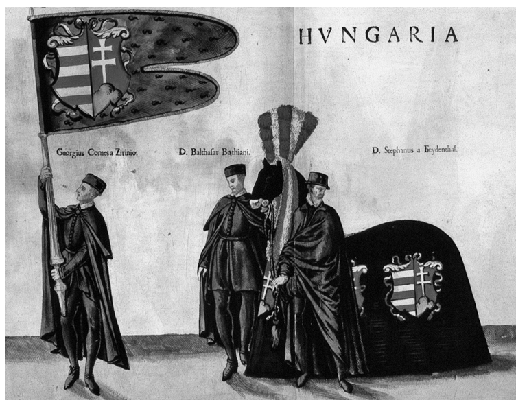
3. kép: Zrínyi György a Magyar Királyság zászlajával I. Ferdinánd császár és király bécsi gyászszerzésén, 1565. augusztus 6-án

A horvát grófból magyar arisztokratává emelkedett kiváló politikusnak és katonának egyáltalán nem kellett szégyenkeznie még közép-európai előkelő rokonai között sem. Az 1563. őszi pozsonyi országgyűlésen neve a Magyar Királyság legfőbb világi méltóságára, a nádor tisztére is felmerült. 1565 augusztusában pedig a Habsburg Monarchia legfőbb hatalmi reprezentációs eseményén, I. Ferdinánd bécsi gyászszerzésén ő vihette a Szent Korona másolatát (lásd a 2. képen). Mindez óriási megtiszteltetés és egyúttal elismerés volt, miközben kiválóan tükrözte Zrínyi pályájának és stratégiaváltásának sikerét.