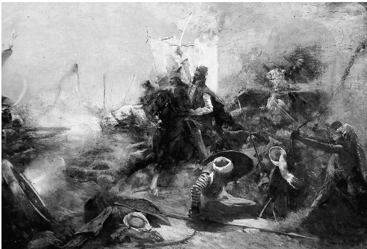
Hollósy Simon: Zrínyi Miklós kirohanása, olaj, vászon, 1896

nek vannak tartóoszlopai. A Zrínyiek öröksége ilyen. Azt is sokan tudják, hogy a Zrínyi-hagyománynak vannak meghatározó városai: Szigetvár, Csáktornya, Ozalj és Bakar. De hogy el kell-e oda menni, meg kell-e érinteni az ottani ódon falakat, s fizikai-lelki kapcsolatba kerülni a múlttal, arról már megoszlanak a vélemények. A mai világban már sokan úgy gondolják és érzik, hogy a történelem, az irodalom vagy a művészet- és zenetörténet csupán iskolai tananyag és akadémiai értekezés tárgya. Sokan veszítették el akár önhibájukból, akár mások hibái okán a múlttal való azonosulás lelki képességét. Egyre kevesebben érzékenyülnek el a mohácsi síkon, az aradi kivégzőhelyen vagy a magyar honvédség második világháborús hőstetteinek helyén, a tordai ütközet beazonosítható pontjain. Nem vigasz nekünk, hogy így van ez másutt is, sok helyütt szerte a világban. Küzdenünk kell ellene éppúgy, miként már Kölcsey is tette a maga korában. Az ő példája is azt mutatja, hogy van értelme, mert váteszi dörgedelmei hatottak, máig velünk vannak. Nekünk sem szabad megijednünk a kemény és igaz szavaktól, mert a nemzet összetartó kovászáról van szó. Ki fogalmazhat ebben hitelesebben, mint az írók, akik továbbra is, a modern korok-