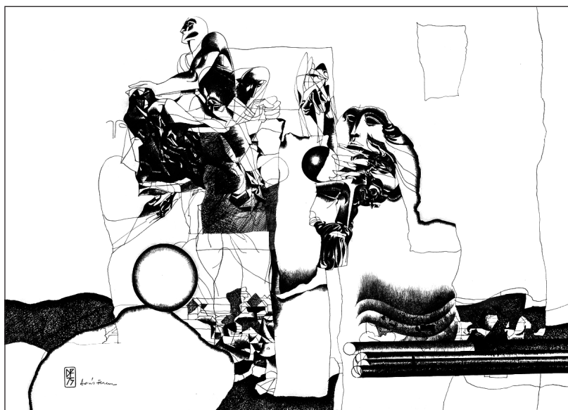
Deák Ferenc: Szárhegyi emlék, 1975 (Csiki Székely Múzeum, Csíkszereda)