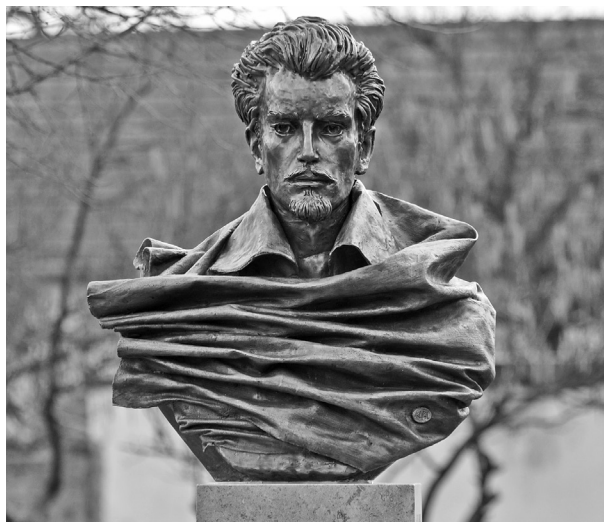
Petőfi Sándor (Tiszaalpár, 2009)

ságnak a műben és műként való léte: a szépség” – ahogyan Martin Heidegger definiálja. „Akár a hó, még esőmosta csönd pihent / az almafák hamvaskék lombjai alatt, / halk, ébredés-lehelte béke volt a kert, / zárt ablakok mögött zsongott a nap, / s fehér mezőkön át a szél, / a nap mezőier’. / Én hallgatok. Gyerekkorom a fű / zenéje volt, és margaréták tengere. / Megfoghatatlan mélyű ízét keserű / bodza örzi, fűzfa méze, kenyér bele. (...) Nyár, hajnali ég, én hallgatok, csak a szél, / csak az érintetlen porba ejtett faág / emlékezik, csak véletlen rajzokba fér, / ész el nem éri földem távolát: / – csöndes, műhely előtti kép – / a rögös arcokét, / foszlott kötének, nyútt zsebek alatt / a megbúvó kezek repecskes partjait. / A spalletták mögött egy másik ég vakít, / sárkányként nyeli el a dombokat a nap” – szól a Földem című elégiából. Különösen ennek a versremeknek a zsongító csendzúgása és dús emléképeket egymásra rétegző borongása tudja olyannyira megragadóan érzékeltetni az egyszerre közeli és távoli, ésszel felfoghatatlan