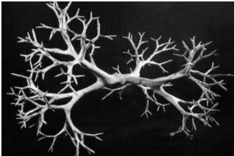
Kétfelé nővő fa (1987)