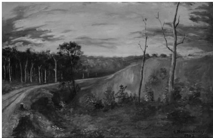
Csáth Géza festménye