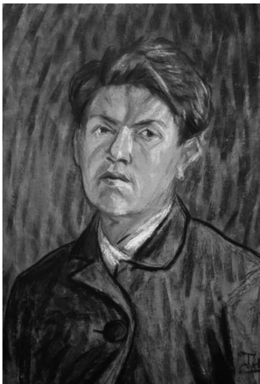
Fiatalkori önarckép (1924–25)