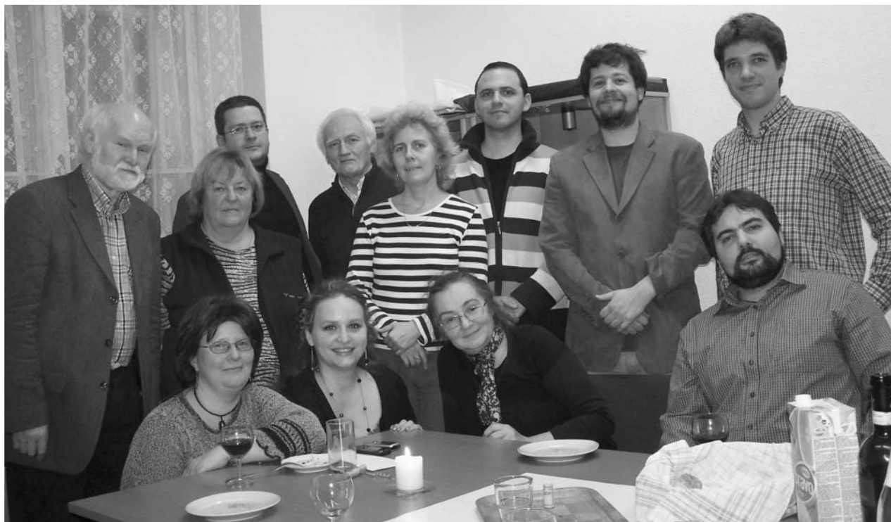
„A Magyar Napló szerkesztőségében”