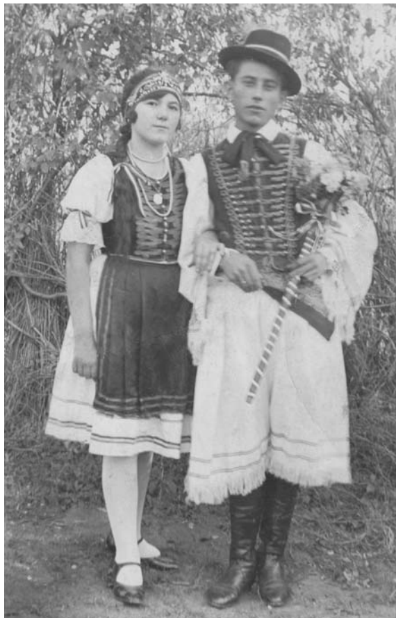
„Anyai nagyszüleim szüreti mulatságban Tökölön, 1929-ben”