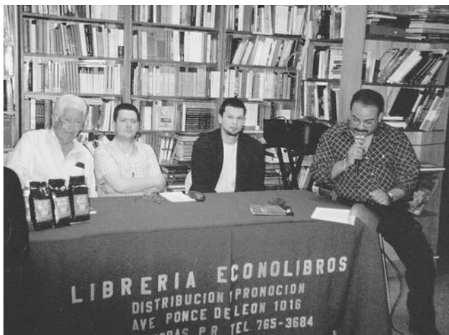
„Puerto Ricóban 2006-ban”

napközis tanár, kerületi újságíró... Viszonylag korán alapítottam családot, és az egyetem mellett a kenyérkereső munkákat is próbáltam úgy