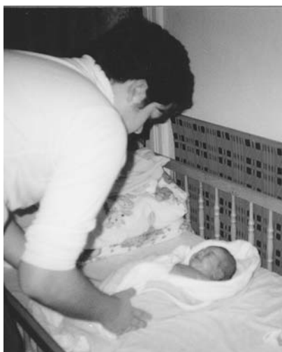
„Újdonsült apaként 1998-ban”

pályát futott be, de érdemtelenül hallgatnak róluk. Pedig a Stádium Gérecz után Béri, Szathmáry műveiből is megjelentetett egy-egy kötetet, sőt 1995-ben Füveskert 1954–1995 címmel egy vaskos, hiánypótló antológiát.