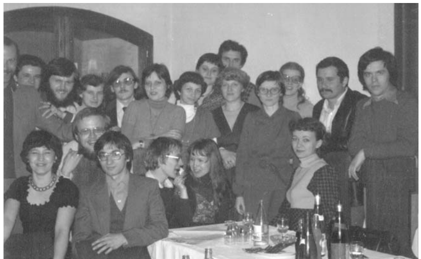
„Pataki osztálytalálkozó – felül balról az ötödik vagyok én”

– Kitűnik mindebből, hogy a nyolcvanas évek elejétől-derekától a társadalmi-politikai közélet sűrűjében