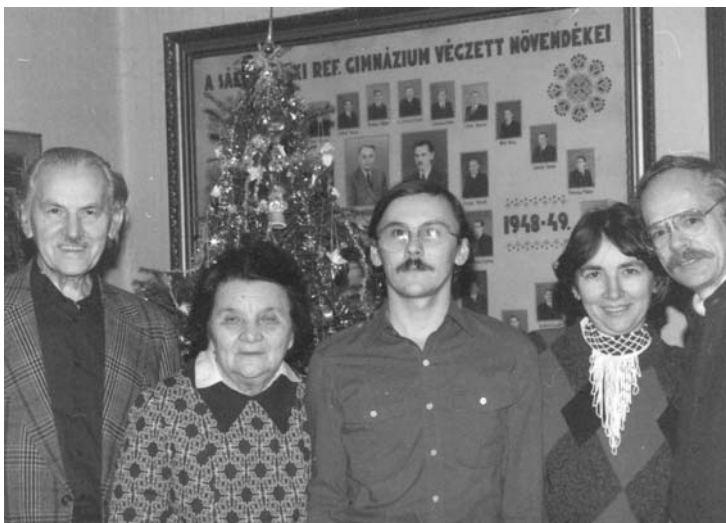
„Szüleimmel, nővéremmel és férjével”

első önálló tanulmánykötetemet is megjelent), már előbb. Éppen az első darabokat a Mozgó Világban ismertető írásaim után néhány hónappal tiltották be a folyóiratot, majd '86-ban a Tiszatájat és így tovább. Mi nem győztünk eleget háborogni, terjesztettük a vala-