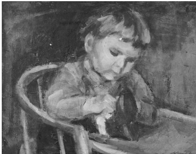
„Cipőfűzős festmény rólam”