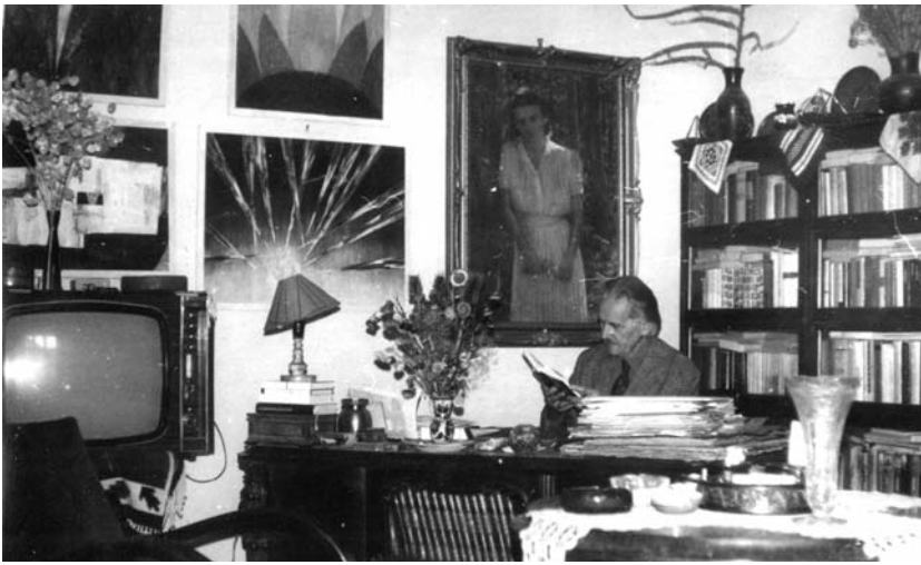
„Pataki szobabelső – édesapám feje fölött édesanyámról készített portréja”

alapvetően Patakon élve ez a csodálatos hely nevelt iskoláival, történelmi levegőjével, egész környezetével. A Bodrogot övező jegenyékkal, a hegyaljai dombokkal és az ezer színben tarkálló szőlőhegyekkel. Vannak vidékek, ahol „véremmel rokon a patak” – vallja a Kányádi-vers olyképpen a költő székelyföldi bölcsőhelyéről, hogy azzal minden olvasó azonosulhat a sajátjára gondolva, s köztük én is közvetlenül ugyanezt érezhettem a „Bodrog-parti Athént” idézve. De ráadásul úgy, hogy ezzel a mélyseges és bensőséges szeretetvisztonnyal gyökeresen nőhetett és nőtt össze bennem a másik táj: a nagyalföldi síkságok, a tiszai nyárfák, a termő gyümölcsösök és a hatalmas kerek kék ég ígérete. Egyszerre és együtt: kertek és mezők, artézi kutak és dinnyeföldek, locsolás utáni nyáresti petúniák és estikék illata és hangulata – és a vulkáni csipkészetű zempléni hegyvonulatok, a tengerszemek sziklatornyok, az éles levegő, a korcsolyázásra alkalmassá fagyott folyókiöntések varázsa és atmoszférája. Ahogyan a bodrogi rétek a Kárpátok felé nyúló magaslatokkal a Hegyalján találkozhatnak.