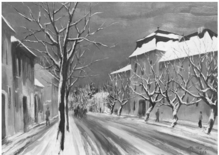
„A pataki alma mater festői képe”

tet parancsát. A biztatást és az ösztönzést a szülőfölkök egymásba láncolódásából, szférikus összefonódásából kifejlő láthatár egészének a körbetekintésére. Rosszul mondom: nem parancs volt ez; hanem még a kövekbe, a történelmi falakba is beleivódott természetessége, tapinthatóan példasugárzó életessége a mindennapoknak. Olyan élményközeg, amely szavak nélkül is mosolyogva szólított, intett a hűség, a ragaszkodás, a tiszta emberiség örömeinek megbecsülésére, létigazító lehetőségének kihasználására. A humán kultúra mint szerves közösségi hagyományvilág – minden érzelmileg és értelmileg felfogható morális sugallatával – nem valamiféle elvont tananyagként, hanem a köznapok meghittségében empirikusan átélhetővé váló tényvalóságként övezte eszmélkedésem meghatározó mozzanatait. A pataki szülői lakás például voltaképpen az ősi református kollégiumhoz tartozó egyik úgynevezett tanári házban (a református templom tövében, közel a Bodroghoz) foglalt helyet – egy XVIII. századi műemlék-épületben. Ez a ház – csaknem egyméteres vastag falaiival, boltíves mennyezeteivel, hatalmas borpincéjével, kőkeretes ablakaival, alacsony és díszesre faragott faajtóival –