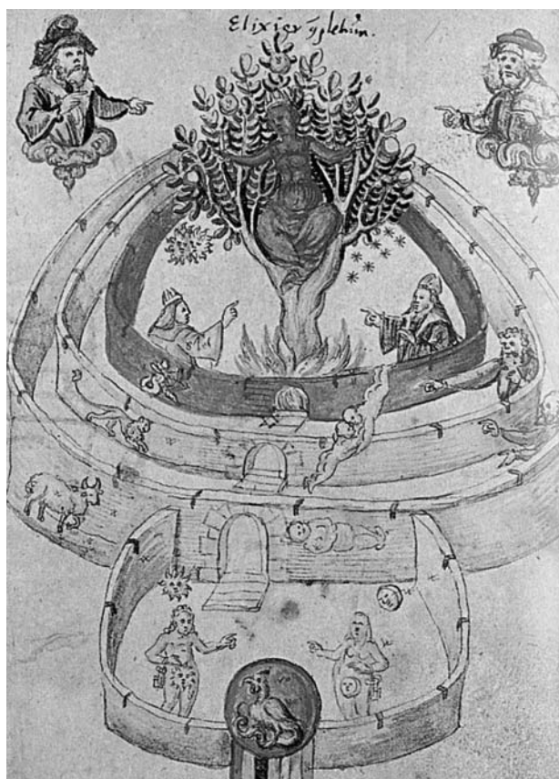
Mercurius a kémcsőben feltüzeli a „primateriális” sárkányt és szárnyat ad neki, vagyis az elkezd párologni. A vér, amellyel táplálja, az univerzális szellem, minden dolgok lelke.

Bormisztikai vizsgálódásunk számára az orvoslás és a kuruzslás bor-alkímiájánál izgalmasabb a hermetikus hagyomány bor szimbolizmusa. Az, hogy a bor milyen szerepet kap abban a képletben, amelyet az „örök fia-