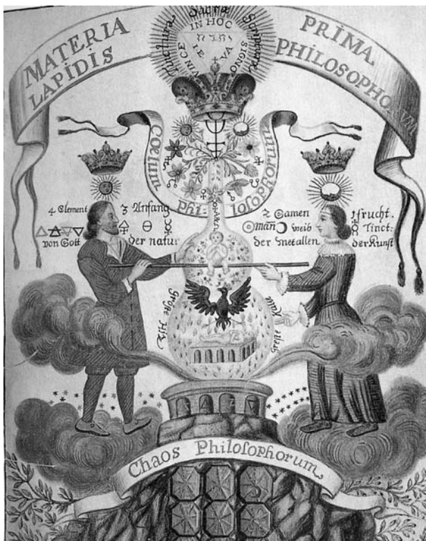
Az első udvarban: Sulfur és Mercurius, a matéria két alapkomponense. A három fal a mű három szakaszát ábrázolja, amely tavasszal a Kos állatjeggyel és az oszlásban lévő halott testtel kezdődik. Nyáron, az Oroszlán jegyében történik meg a szellem és a lélek egyesülése, és decemberben, a Nyilas jegyében jön létre az elpusztíthatatlan, vörös szellemtest, az elixír; avagy az „örök fiatalság iható aranya”.

A római katolikus egyház természetesen gyanakvással figyelte és tiltotta ezeket az elképzeléseket. Érthető is, hogy miért, elég, ha csak a mindenféle szinkretizmus szimbólum- és misztériumromboló hatására utalnak. Főleg ha arra gondolunk, hogy az alkímia legmagasabb művelői egy új kinyilatkoztatásra törekedtek, aminek lényegét Georg von Welling Opus mago-cabbalisticum című művének bevezetőjében így fogalmazza meg: „...nem az a szándékunk, hogy arra oktassunk, hogyan kell aranyat előállítani, hanem ennél valami sokkal magasabb: megtudni, hogyan láthatjuk és mutathatjuk be a Természetet, mint Isten eredőjét, és Istent a természetben”. 21 Ebben a képletben aggodalom-