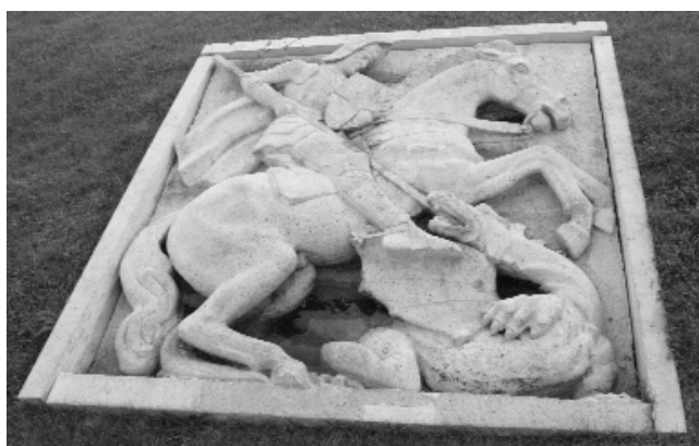
Sárkányölő Szent György (Szent György tér)

– A Budavári Önkormányzat kiterjedt testvérvárosi kapcsolatrendszerrel rendelkezik. Véletlen találkozások alakították ezeket a kapcsolatokat, vagy tudatos választások?