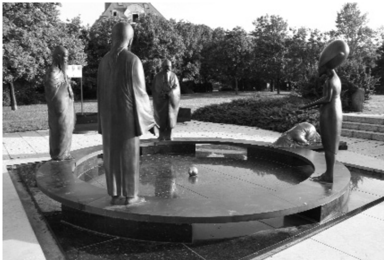
Filozófiai kert (Gellért-hegy)

– A magyar nyelv megtartása mára már nemcsak az Amerikába, Nyugat-Európába kivándorolt, nemcsak az első világháborúban elcsatolt ország-részek jogfosztott magyarjai, nemcsak a Kárpátok keleti lejtőin élő csángók