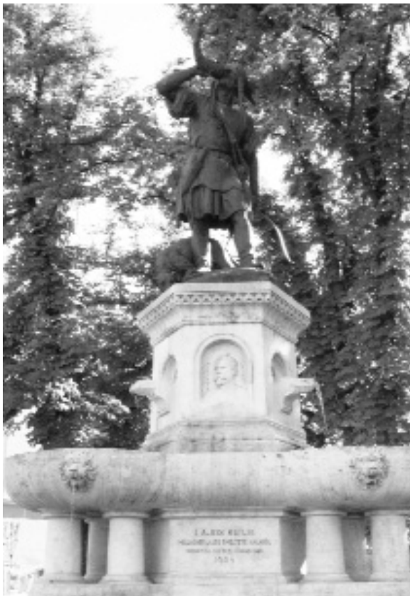
Lajos kútja (Holló Barnabás szobra, Corvin tér)

belépni a közéletbe, képviselni saját véleményünket, érvényt szerezni jobbító szándékainknak egy hason-