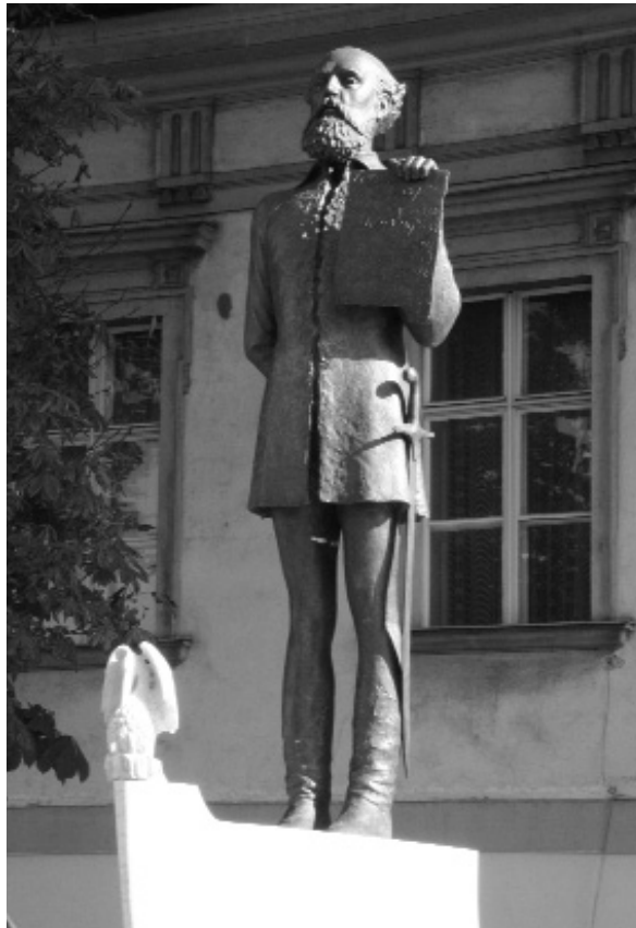
Stremeny Géza: Batthyány Lajos

olcsóbb épületekbe, a Palotanegyedbe pedig szállodáknak helyet adni. Remélem azonban, hogy ezek az elképzelések a közeljövőben nem realizálódnak, a Várnegyed mindig is a magyar kultúra lakott fellegvára marad. Az tehetné nyitottabbá és az