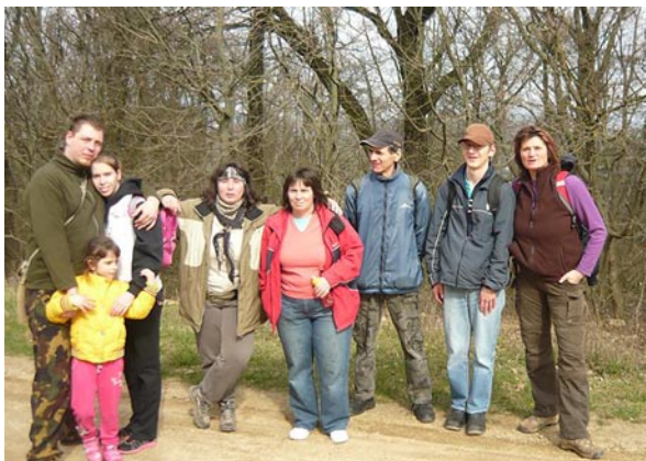
Budai kék 2. csoportkép