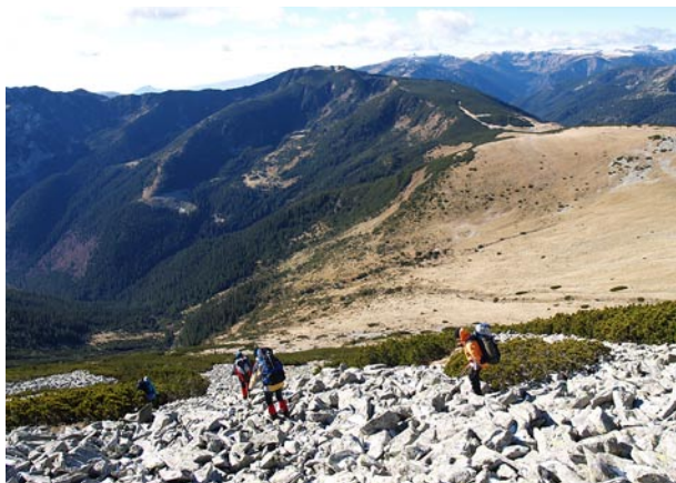
Billegő köveken haladtunk