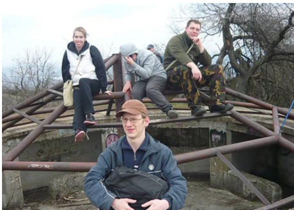
Budai kék 2, a világháborús bunker maradványain