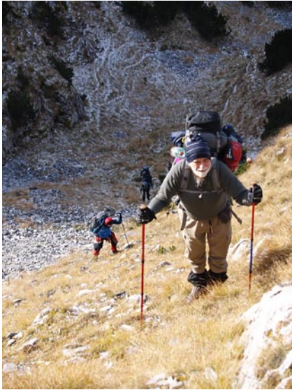
Retyezát, Tulisa túra