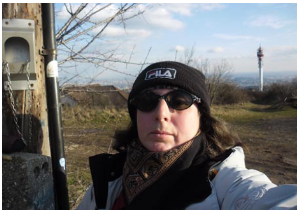
Budai kéktúra 1. pecsételőnél