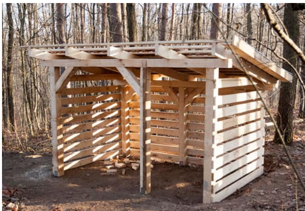
A Les-ház megrongálódott fatárolóját felváltja egy hasonló méretű, de megalapozot és megerősített változat