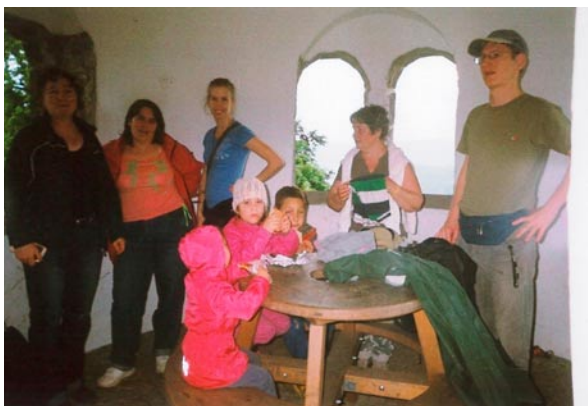
Börzsöny 2. a vendégmarasztaló Törökmezőn