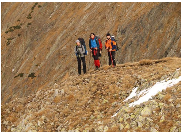
A Lázár-csúcs után köves lett a terep