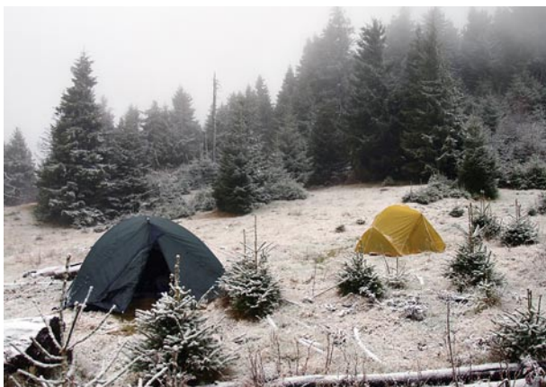
Táborozás téli körülmények között