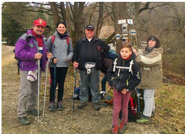
Pilis 2. kéktúra szakasz