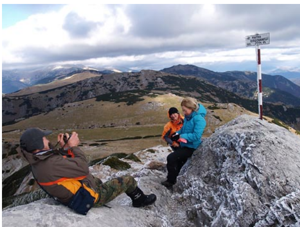
A Jorgován-kő túra