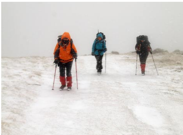
Havazás, közepes erősségű szél, látótávolság 50-100 méter ..