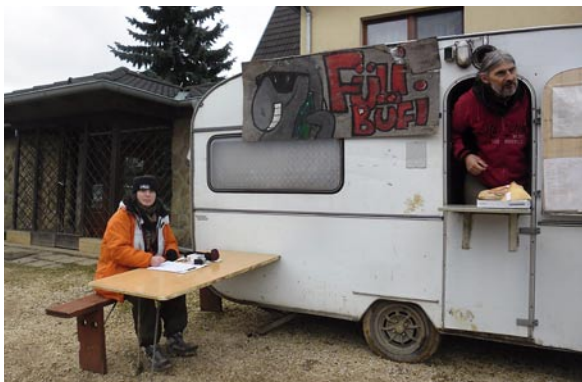
A Budai kéktúra 1. előtt pontörködtem