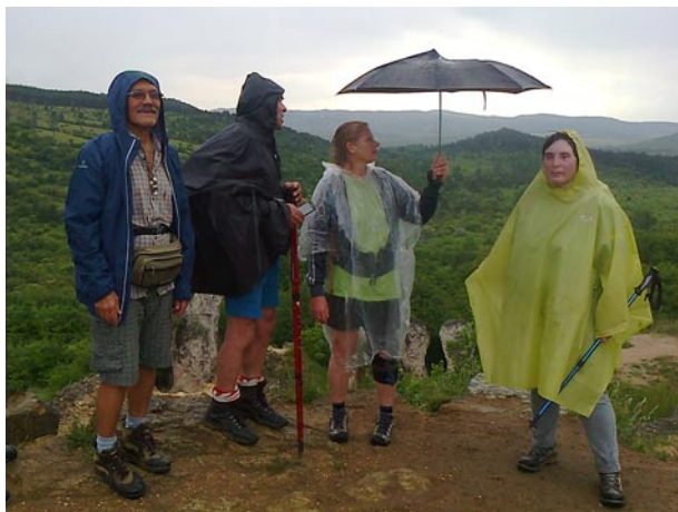
Dobogókő-Budapest kéktúra szakasz