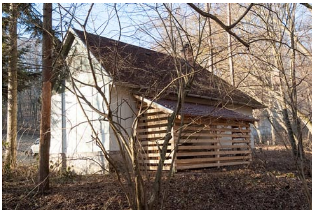
A romjaiból megújított Guba-ház az idén fatárolóval bővült