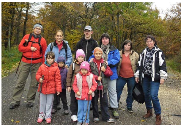
Pilis 1. kéktúra szakasz