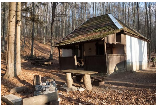
Az országos kéktúra bükki vonalán elhelyezkedő, megújult tetőszerkezetű Örkö-ház