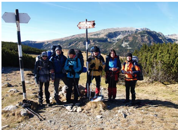
Az erős szél ellenére jól sikerült közös fotó