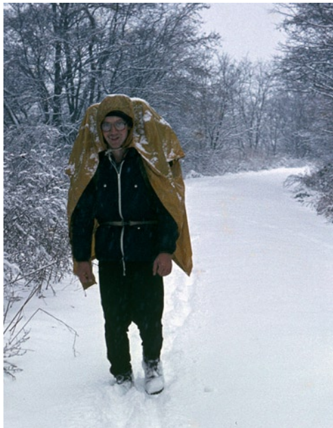
A sűrű hóesésben