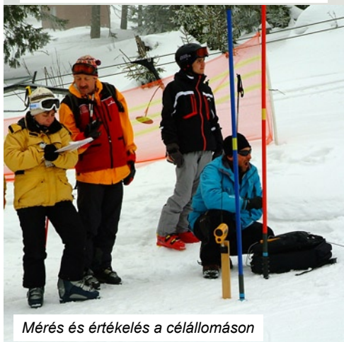
Mérés és értékelés a célállomáson