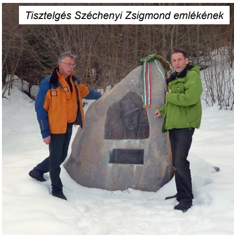
Tisztelgés Széchenyi Zsigmond emlékének