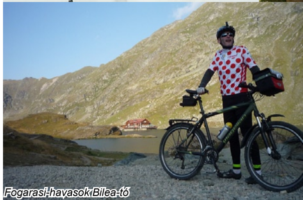
Fogarasi havasok Bilea-tó