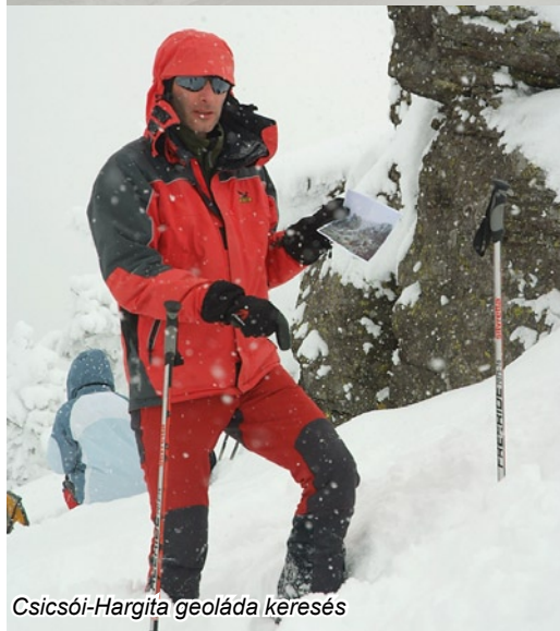
Csicsói-Hargita geoláda keresés