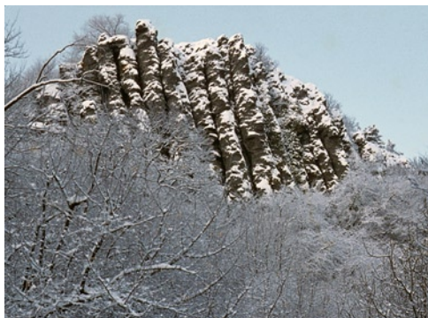
Szt. György hegy

száznyolcvanot vissza keletnek és már lent is voltunk a Lengyel kápolnánál. Szigligetre hamar beértünk. Hiába, a műút, az csak műút! De még így is lassúak voltunk. Szigliget szintén meseország, szintén elvarázsolt. És csodaszép volt Badacsony is. A balatoni látkép meghatározó jelensége. Ahányszor csak erre járok, irigylem az állandó jelleggel itt lakó népeket, akik e varázslatos tájnak szerves részei, akik e varázslatban folyton benne élnek. (A Balatont és közvetlen környékét, csak holt szezonban tudom elviselni.)