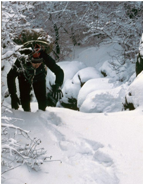
Mászás a Szt. György hegyre

Szokásunkhoz híven, egy kicsit ismét eltévedtünk ugyan, de hamar megtaláltuk a turistaházat. A feketeleves a hegy másik oldalán várt ránk. A szőlőskertek kerítés-pókhálójában úgy keresgéltek a kivezető ösvényt, mint Algernon a kisegér (Virágot Algernonnak: Daniel Keyes) a labirintusból. A kék jelzést festő turisták, mint ha nem is maguknak festenek a jelzéseket, vagy hát, nem is tudom, hogy ki kinek festi a jeleket! Na, ha majd én festek! Én majd jobban csinálom! Csak kerüljünk le innen végre valahára! Szent György-hegy oldalában, óramutató járásával egyezően, kétszázhetven fokot tekeregtünk nyugatra, majd néhány tíz méterrel lejjebb, majdnem