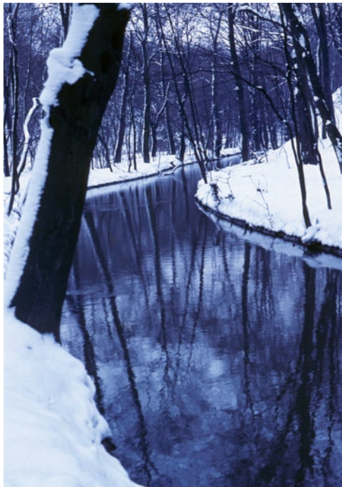
Patakcsendélet a Bakonyban

Szilveszterezni a régi bányászházakat a környékbeli turista egyesületek bérelték ki. Két székesfehérvári túrávezető segített az elveszett idő behozásában és a