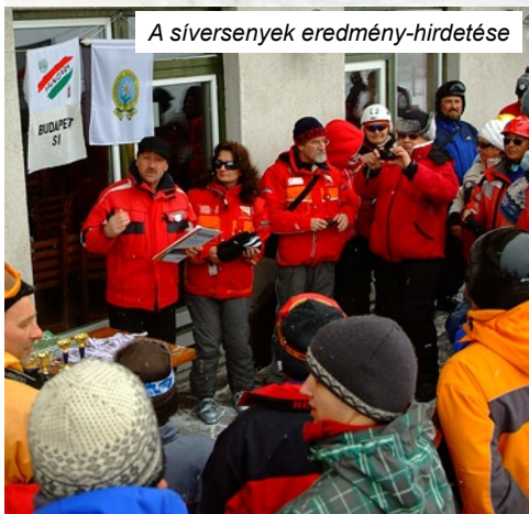
A síversenyek eredmény-hirdetése