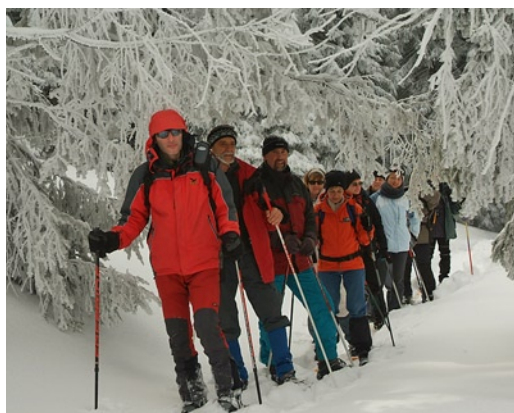
Túravezetőként a Madarasi-Hargitán