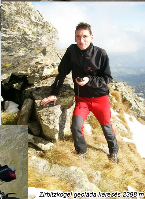
Zirbitzkogel geoláda keresés 2398 m