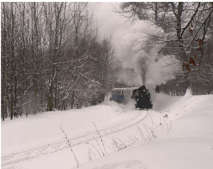
Az úttörő-, ma gyermekvasút

Holnap vasárnap. Holnap pihenőnap lesz. Bár a turisták a pihenőnapokon túrázni mennek, ez alkalommal én nem leszek turista!