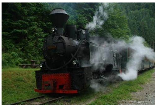
Visó-völgyi varázslat: Elvetia a népszerű gőzmozdony a turista végállomáson