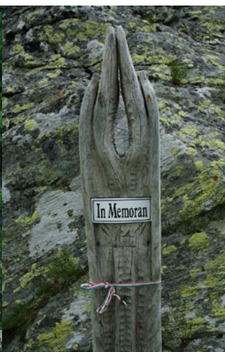
Salgótarjániak megrongált emlékműve a Mosolygó-katlanban