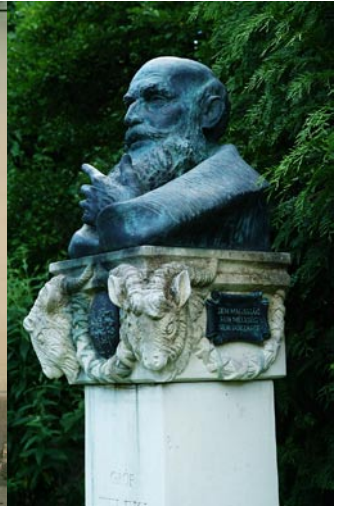
Gróf Teleki Sándor