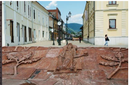
Nagybánya, Szt. István emlékmű