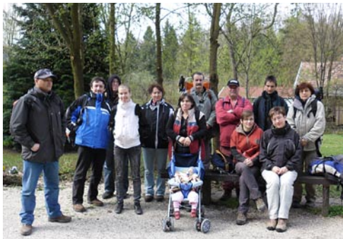
A királyréti gyülekező

A turista olyan emberfajta, aki közgyűlésre is lábon megy, és hogy élmény is legyen a dologból, az erdő közepén közgyűlik. Kies „Kárpátok” kulcsosházunk biztonságos falakat adott a fontos eseményhez, de addig el is kellett jutnunk. Így már kora reggel gyűltünk a Nyugati pályaudvaron, majd a királyréti kisonatnál. Túrázó kedvű ifjúságunk és közgyűlésre készülő komoly felnőttek együtt próbálták felférközni az ugyancsak megtelt kisvasútra. Helyfoglalás után még egy nagy csomagokkal megrakott csapat is bepréslődött, így az első állomásig átváltottunk heringes doboz stílusra. Királyréten csatlakozott hozzánk