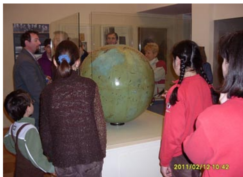
A nevezetes Földgömb

A múzeum kertjében felfedezőink mellszobrait is megcsodálhattuk, múzeumi kísértőnk minden szobornál mondott egy rövid anekdotát az illető utazóról, vagy a szobor keletkezésének körülményeiről. Ezután átkalauzoltak a szomszédos Helytörténeti gyűjteménybe, ahol a helyi német nemzetiség életformájáról és a KALOT mozgalomról láttunk tárlatot egy kisrepülőgép modelljével társítva. A KALOT idegenvezetőnk elmondása szerint egy katolikus legénymozgalom volt. Célul tűzte ki a vidéki szegény sorsú fiatalok esélyegyenlőségének, taníttatásának felkarolását. 1944-ben a nyilasok betiltották, 1945 után pedig a kommunista rendszer megszüntette.