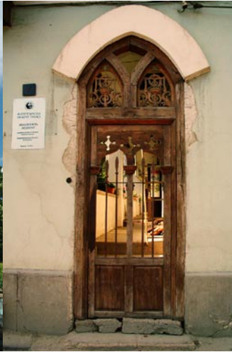
Teleki ház ódon bejárata