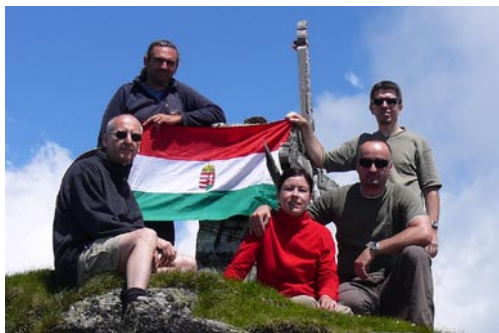
Az Ünő-kő tetején