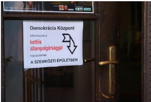
Magyarok Demokrácia Központja