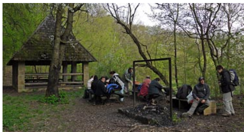
A bajdázói pihenő

Bajdázó környékére értünk, bokáink már erősen érezték a terep viszontagságait, de még át kellett vergődünk egy rakás kidőlő fa alatt-fölött-mellett, hogy végre megpihenhessünk a tó melletti padokon. Néhány ifjú vállalkozó a nyitott kőbányát is megszemlélte túravezetőnkkel, a többiek uzsonnázás közben elmerültek a Bajdázó-tó látványában – szerencsére a tóban nem!