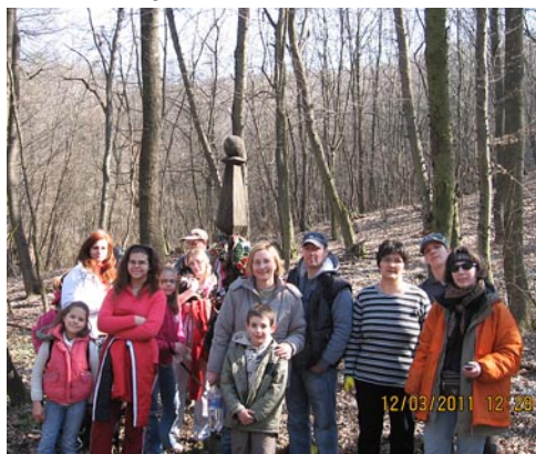
A Rockenbauer Kopjafánál

Egy hatalmas mesebeli tölgy padnak is beillő gyökerein tartottuk újabb pihenőnket, majd utolsó lendületünkkel átvagódtunk a maradék pocsolján, havas-jeges keréknymon és egyéb sáros akadályokon, hogy végre a Bik-kút körüli szépen kiépített pihenőhelyen ebédelhessünk. Kutyusaink természetesen minden előkerülő szendvics láttán eljásztották az éhhalál küszöbén álló állatseregletet, de mindenki a saját elemőziájával lakott jól. A forrásvíz fagyaszttással felérő megköstölése után gyermekeink hídépítő akcióba kezdtek a csermely mellett, míg a felnőttek kipihenték a sártaposás fáradalmait. Túravezetőnk azzal biztatta a csapatot, hogy innentől hamarosan ösvény vezet tovább, ami szárazabb lesz, mint a teherautók-járta földút, így össznépi fotózás után tovább indultunk a hegytető felé.