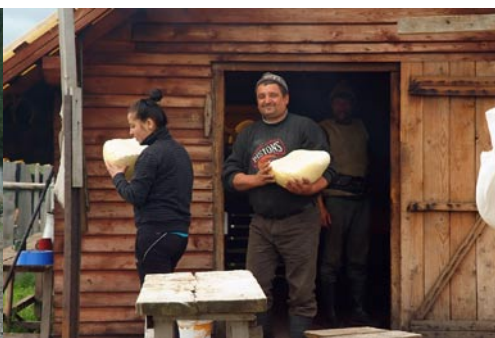
Terülj aztalkám egy esztenában. Sajt, orda, tejföl, puliszka és jó hangulat