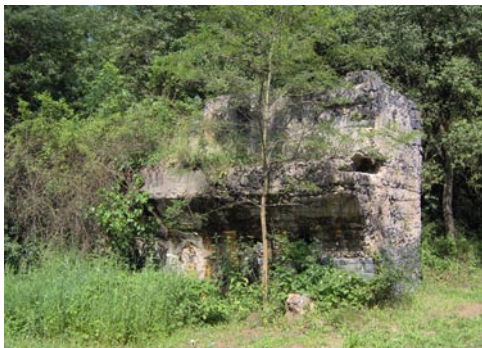
Ismeretlen eredetű kőépítmény

Lottóhúzás este lesz, addig haza kell érnünk, így folytattuk utunkat Eresztvény felé. A zöld jelzés most már tartósan mellénk szegődött, így hamarosan a Madár-tanösvény parkjának kemény mellű nénijénél kötöttünk ki. A néni köszoborként találtaik a parkban, még mielőtt valaki rosszra gondolna (nevét egy korábbi túrán kapta csapatunktól, mikor is egyik eltévelyedett túratársunkat ugrattuk azzal, hogy mi csoda kemény mellű menyecskeréről maradt le).