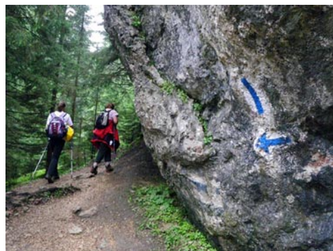
Egyeskőre vezető úton

mesközéplek, lóháton vagy gyalog innen bizony 35 km. Legkönnyebb lenne az alig 10 km távolságra lévő Balánbányához vezető, igen rossz állapotú utat építeni ki. Először persze az Olt felső folyása mellett haladó 125A jelzésű földutat kellene rendesen megépíteni Gyergyószentmiklós (a 4-es kilométer) és Balánbánya között. Ha bármelyik közlekedési kapcsolat megvalósulna, úgy páratlan turista-régió alakulhatna ki a Hagymás-hegységet közrefogó két párhuzamos völgyben, Gyergyó és Csík határán, Erdély keleti határszélén, és Háromkút lenne a hegyi túrák és a téli sportélet központja. Félő azonban, hogy a közelmúltban létrehozott Békás-Hagymás Nemzeti Park egyetlen tényleges funkciója a turisták távtartása lesz. Ugyanis ellentétben Amerikával és Nyugat-Európával, miféleképpen a természetvédelem nem közelebb akarja hozni az emberhez a természetet, hanem távol akarja tartani az embereket a legszebb tájaktól. Rendben, én sem szeretném, ha ellepné a tömeg a Nagy-Hagymást, de legyen arrafelé kiépített út, menedékház, jelzett turistautak, ellenőrzött kerektek között folyjék a fakitermelés, és maradjon fenn az állattartás. Ahogy mindez az Alpokban természé-