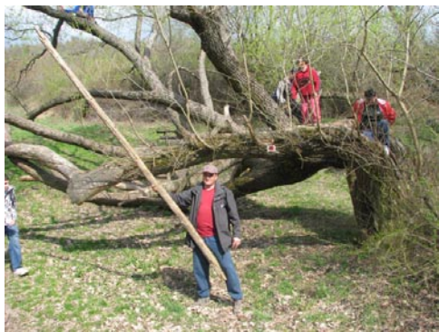
Zoli utat mutat

Ezután az árvíz által megtépzott úton átkelve újabb rövid pihenő következett, melynek napirendi pontjai: 1. harcedzett ifjaink megrohamozták a közeli játszóteret, 2. helyi lakos megrökönyödése a látottakon, 3. helyi lakos megnyugtatása, hogy nem tesszük tönkre a játékokat, 4. uzsonna (ezt többnyire a felnőttek követték el), 5. a játszótér melletti hatalmas kőépítmény rendeltetésének kitalálása. – No, ez utóbbi sikertelenül zárult, pedig nem először álltunk a „valami” előtt, de 2006 óta nem jöttünk rá, mi ez. (kép mellékelve, lehet találgatni.)