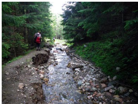
Olt-bükk patak mentén

mint 90 méterrel följebb láttunk volna. Közben találkoztunk egy nagyobb túrázó csapattal, akik komoly csomagokkal kapaszkodtak fölfelé. Románok voltak, de néhányan beszéltek egy keveset magyarul. Lassan talán az erre megforduló románok is rájönnek, nem elég, hogy az erdélyi magyarok tudjanak románul, illene, hogy az erdélyi románok is tanuljanak, tanulhassanak magyarul – ahogy Dél-Tirolban természetes, hogy az osztrákok az iskolában tanulnak olaszul, az olaszok pedig németül.