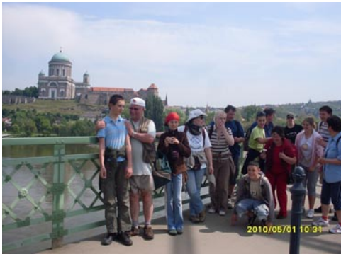
Csoportunk a Duna túlsaján a Burda-hegység tórán (20. old.)

Duna folyó az egyik közös pont az alábbi két felvételen. A bal oldalin a Kárpát Egyesület Ifjúsága túrán résztvevők Párkányban pózoltak a fotográfusnak. A jobb oldalin a Duna már több száz kilométerrel lejjebb, a Kazán szorosban – megcsonkított hazánktól távol hőmpölyög, ahol egyesületi tagjaink és erdélyi barátaink dolgoztak a Kárpátok Bércein Vándorút, túraútvonalának kijelölésében.