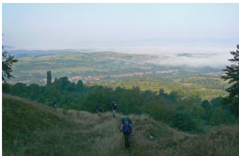
Egyik legkellemesebb táborozásunk után szinte mesebeli a reggeli táj és a ködfátylakba burkolózó falu

Kedves Zsuzsanna, csíkszéki EKE Fotók: Kedves Ferenc, csíkszéki EKE