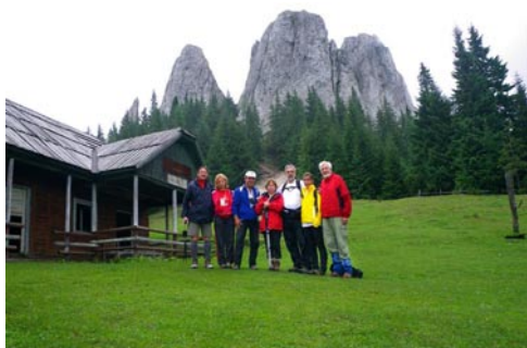
Az Egyeskői ház előtt

lenne a házat helyreállítani, noha a tulajdonjogát nem sikerült visszaszerezniük. A terület mai tulajdonosa, Csíkszentdomokos község, egy új épületet ígér, de azt várja, hogy azt az angyalok majd fölszállítják. Barátaink közben leereszkedtek a szirt hátoldalán, ahonnan némi sziklamászói gyakorlatlal föl lehet kapaszkodni a fantasztikus kilátást nyújtó tetőre. Az izzadságtól csuromvízes ruhadarabjainkat lecserélve és a hideg szél miatt fölöltözve egy kis magaslaton könnyítettünk hátizsákjaink tartalmán, és nézegettük a felhőkől ki-ki bukkanó Nagy-Hagymást, az ellenkező irányban pedig az Öcsém csipkés gerincét.