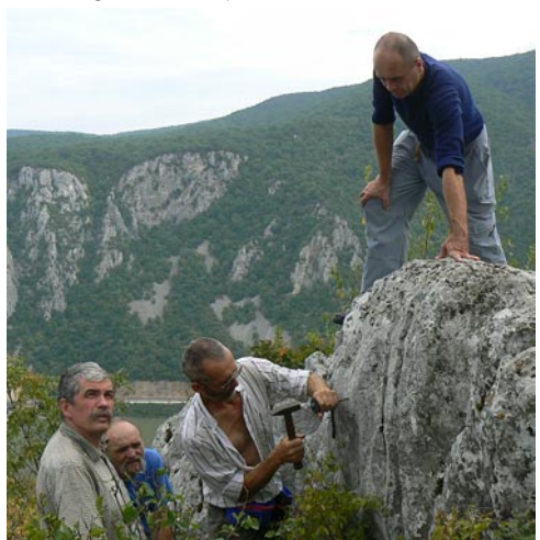
Itt helyezzük el tóránk első, Kárpátok Bércein Vándorút bélyegzőjét (2. old.)