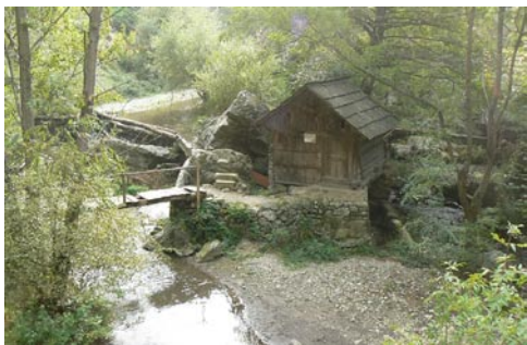
A Rudarica patakon jelenleg is meglévő 22 vízszintes kerekű vízimalom egyike

Ma, rendhagyó módon még két lakott helységet érintünk. Putnát, ahol a falusi üzletben csak sört lehet vásárolni (de a csapatnak tulajdonképpen nem is kell egyéb) és szép erdei úton érkezünk Cseherdős/Sumita-ra.