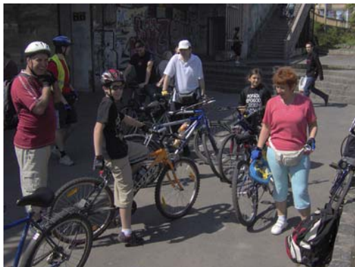
Felkészülés az indulásra