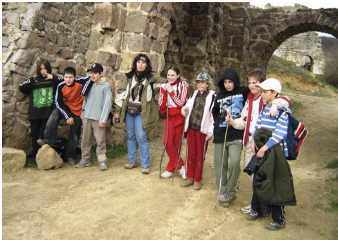
Imrei csapat az „Egri várnál”