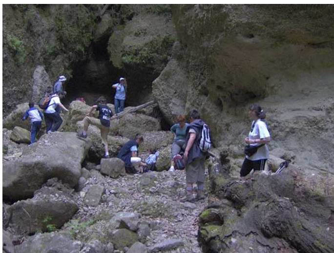
Palóc Grand Kanyon

Egyre szűkülő szurdokban hatalmas sziklákon kellett lépkednünk, de mindnyájan jól vettük az akadályokat, csak mire igazán belelendültünk, addigra véget ért a szurdok. Hiába van a nevében Páris és a Grand kanyon is, ez egy kicsit kisebb, kicsit sárgább (senki nem harapott kőbe, de lehet, hogy kicsit savanyúbb is?)... szóval kicsit magyarább méretű, de a szépségétől így is tátva maradt a szánk! A sziklák elég morzsalékosak, ezért a kanyon falát nem lehetett megmászni, így abban a kegyben részesültünk, hogy visszafelé is végigcsodálhattuk a szurdokot.