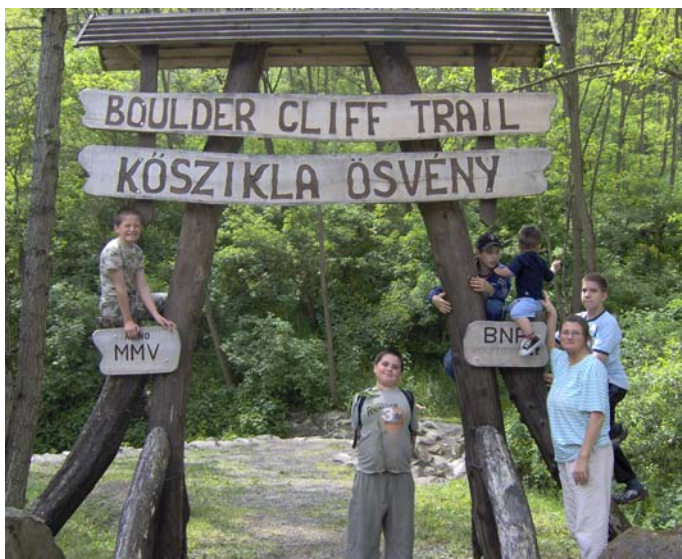
Várakozás a Kőszikla ösvénynél

kifelé, gondolván, hogy a fogadó épületnél találkozunk elcsatangolt túratársainkkal. Mivel ott sem voltak, kimentünk a buszhoz, ahol már volt térerő, így telefonon utol lehetett érni őket. Kissé paprikás hangulatban megvártuk, míg kijönnek (a telefon gyorsított a dolgon), aztán végre közösen elindultunk a palóc Grand Kanyon (Páris patak szurdoka) felé.