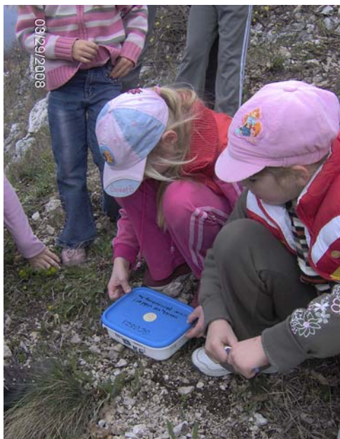
A megtalált első geoláda

A turistaház már romjaiban sem látszott, de a kék túra pecsétjét megtaláltuk egy fán. Mivel geoláda nem volt a közelben, ezért folytattuk utunkat az országos kék jelzésen. Redlinger Adolf útjára szegődtünk, amit pirossal, sárgával és kézzel is megjelöltek, így bizonyosan neve-