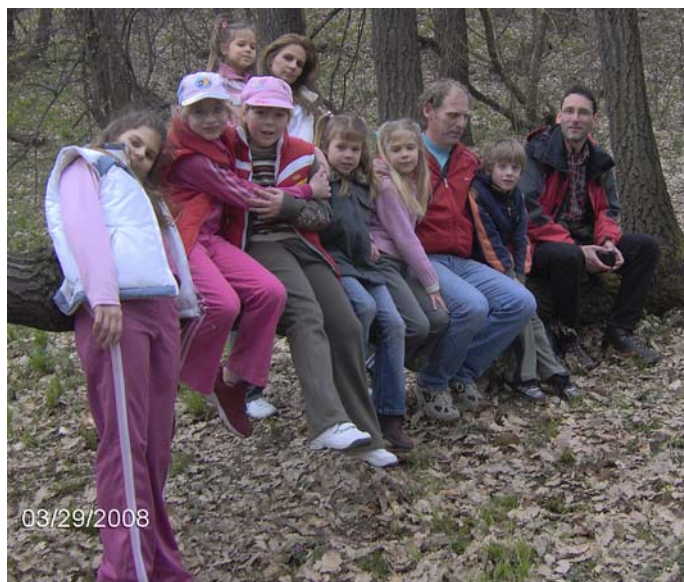
A fóti csapat az Oszolyon

zetes személy lehetett. A kis-sziklás út a Nagy-Kevély oldalában ereszkedik le, középen a Szódás-barlanggal díszítve. Néhány frissebb lábú gyermekünk fölmászott a nyiladékhöz a gyökereken, és rövid hűsülés után csatlakoztak a csapathoz.