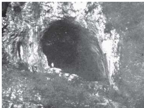
Mézgedi Csárán-barlang egy korabeli emléklapon

Amintirea marelui adorator al muntilor din Bihor IULIU CZÁRÁN a fost eternizata la 8 iunie 1930 de TURISTII ASOCIATIEI SPORTIVE DIN ORADEA