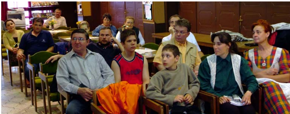
Egyesületi tagjaink és az érdeklődők a kiállítás megnyitóját követő előadáson

Czárán Gyula , „a Bihar szerelmese” a századelőn szinte ismeretlen Bihar-hegységet turisták számára járhatóvá tette. A nehezen megközelíthető, vagy megközelíthetetlen helyeken turistautakat építtetett ki, létrákat, hidakat ácsolatott, hogy a túrázni vágyóknak a hegység leg-szebb pontjait bemutathassa. Vendégeinek maga szervezte a túrákat. A Bihar-hegység az ő feltáró munkája nyomán vált ismertté.