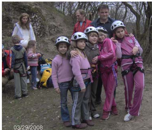
A fóti sziklamászó csapat

Miután körbenéztünk és átbukdácsoltunk a csúcs minden valamire való szikláján, elindultunk lefelé. Mire visszaértünk a mászófalhoz, az imrei csapat még nem végzett, így fölfedeztük a szikla környékét is: jó meredek emelkedők emléktáblával és barlangocskával díszítve, így amíg a felnőttek a bokájukat pihentették, az aprónép (négykéz)lábón járta be az emelkedőket, ha már a mászásra várni kellett.