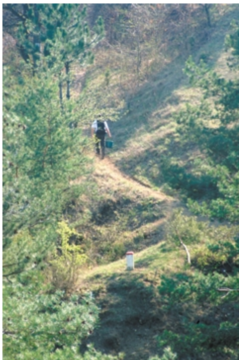
Hegymenetben festés közben pihenünk

Karancsberénytől a határsávban, elindultunk Ipolytarnóc felé. Valamikor réges-régen, Karancsberényből köves út vezetett át a mai