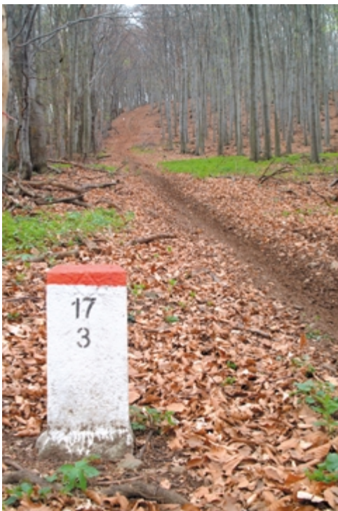
A Karancsra vezető emelkedő elég szelídnek látszik, valójában nagyon meredek

tük a kihelyezendő oszlopok helyét. GPS-szel pontokat vettünk, hogy majd oda fúrjuk le az oszlopokat. A szlovák oldalon még sokáig kísérték a legelő, a magyaron elértük a tölgyest. Az alapozásnál ki kell tisztítani a kiszemelt fa környékét az indáktól, a tövisektől, bokroktól, majd kissé meg kell hántolni a fa kérget, csak azután lehet jól festeni. A tölgyfának kemény kérge van, vöröses kéreghúsa. Az éles hántoló ellenállásra talál a fa kérgén. Így ment ez sokáig, amíg az erdő nem váltott. Kb. két kilométer után a szlovák oldalon került erdő, a magyaron csak mező volt. A szabályzat szerint, csak a magyar oldalon helyezhetünk el jelzéseket. Kis, csenevész gallyakra, ágakra lehetett festenünk, mikor a túloldalon ott voltak az akác és a tölgyfaerdők. Erre a butaságra is csak az ember képes.