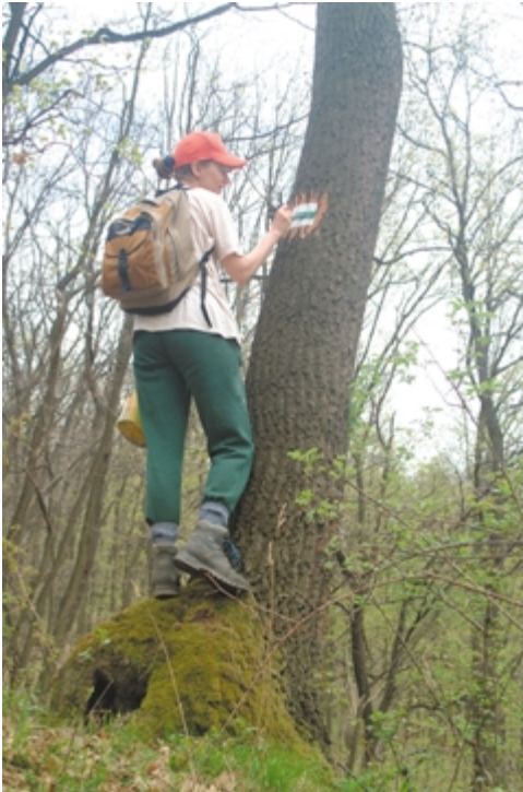
A színes sáv festése

záfoghatunk az alap: a fehér szín festéséhez. A festéket Egyesületünk titkársága részéről kijelölt festéküzletben, utalvány alapján beszerezhetjük. Az ecsetet vagy titkárságunk adja ki elismervény ellenében, vagy pedig az Egyesület költségére magunk vásárolhatjuk meg valamely háztartási cikket árusító üzletben. Inkább kis ecsetet válasszunk (rövid, kevés szőrrel), mert különben a dús és hosszúszerű ecsetet dróttal vagy spárgával kellene lekötnünk, ami bizonyos gyakorlottság hiányában rosszul sikerül. A nagy ecset a festendő, aránylag nem nagy négyszögekhez képest túlsok festéket vesz magába s a fölösleges festék ruhánkra csöpög, de a jelzést is elronthatja.