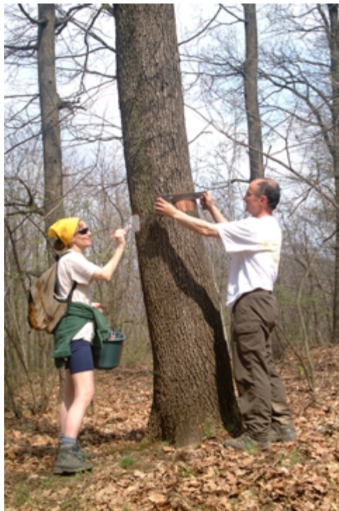
Óvatos kéreg hántolás után jön az alapozás

Szükséges tehát, hogy ezen hasonló „előkészítéseket” már az út bejárásakor elvégezzük, mert csak így mehet a jelzés tulajdonképpen munkája a legközelebbi alkalommal zavartalanul végbe. A cölöpök beveréséhez egy kisebb balta, a gödörásáshoz pedig egy rövidnyelű, a hátizsákban is elhelyezhető kis ásó elegendő szerszám.