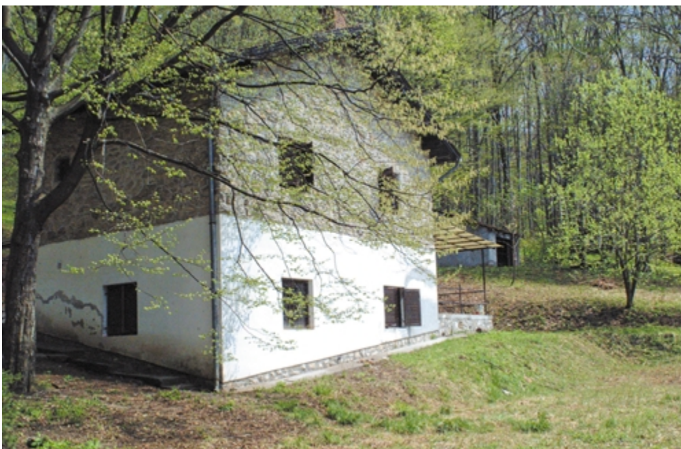
Az MKE tábor 2005 tervezett helyszíne. Lesz hely bőven a „munkatábor” sátrai számára. Hagyunk egy kis tennivalót is...