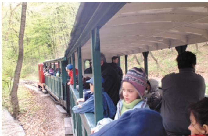
A megduzzadt patak mellett, csodálatosan szép erdőben vonatoztunk a kék-szalag turistajelzés vonalán