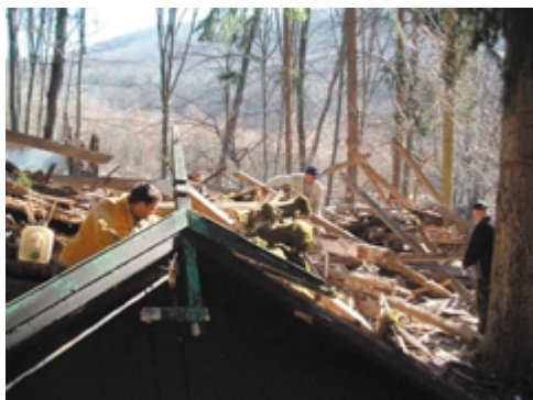
A hajdani szép kulcsosház most elszállítani való törmelék. Ennek helyén újat építünk

Mindezen anyagi nehézségektől függetlenül, – az elhúzódó tél miatt igencsak kapkodva kellett nekikezdeni a helyszíni munkálatoknak. A decemberi MKE elkölségi