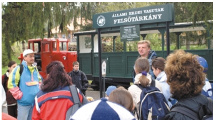
A vonatrászállás előtti eligazítás