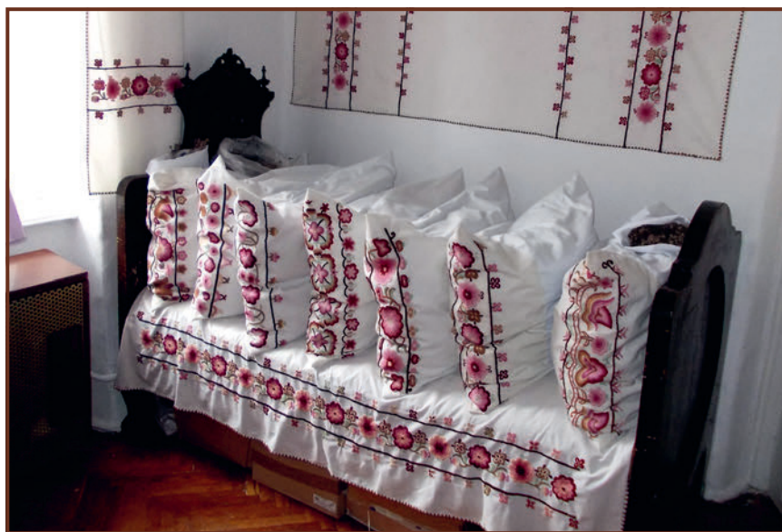
Részlet a kiállításból