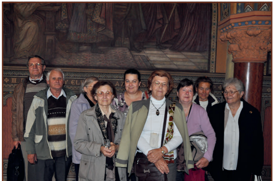
Levéltár látogatás 2014-ben a MNL Bécsi kapu téri épületében

2009. szeptember 17-én és 18-án tartottuk az első összejövetelünket. A kölcsönös ismerkedést, szervezési kérdések tisztázását követően megkezdtük az előre elhatározott tematika szerinti munkát, amely eleinte a legfontosabb (folytatás a 28. oldalon)