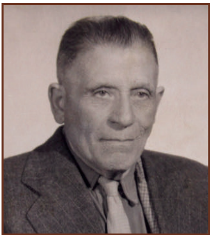
A nyugdíjas tanár 1958-ban

https://magyarmegmaradasert.hu/files/k_aktatar/fa_er_2.pdf http://adatbank.transindex.ro/html/cim_pdf2442.pdf file:///C:/Users/user/Downloads/rem_2%20(1).pdf https://hargitanepe.eu/brassai-tanarur-es-a-csiki-muveszeti-neveles/ https://en.mandadb.hu/common/fileservlet/document/332255/default/doc_url/magyar_irok_elete_es_munkai_XVII_kotet.pdf http://misc.bibl.u-szeged.hu/46326/1/hargitavaralja_1937_044_048.pdf