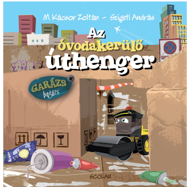
M. Kácsor Zoltán – Szigeti András Az óvodakerülő úthenger Scolar Kiadó, 2014, 24 oldal, 1495 Ft

A gép(ies) meséket némileg feldobják Szigeti András élénk, mozgalmas illusztrációi: a sorozat védjegye is lehetne, hogy a keménytáblás címlap mindig nyitott, egy nyílason-kerítés-rezen vagy kulcslyukon pedig kikandikál az aktuális könyv főszereplője. Szigeti reálsan rajzolja meg az egyes munkagépeket, de a Pixar-hatást ő sem tudja elkerülni, mindegyik figurája nagy emberi szemeket kap, és teli szájjal mosolyog,