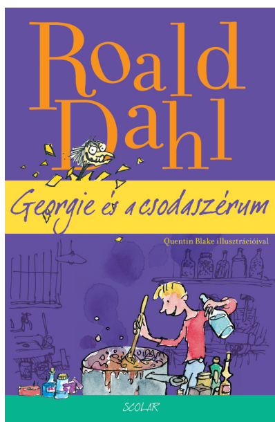
Roald Dahl Georgie és a csodaszérum Scolar Kiadó, 2014, 112 oldal, 1750 Ft