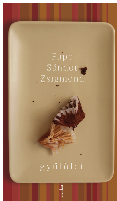
Papp Sándor Zsigmond Gyűlölet Jelenkor Kiadó, 2018, 476 oldal, 3499 Ft

Akkor szerettem volna befejezni, amikor úgy éreztem, hogy még van egy kis remény. Talán visszafordítható minden, hiába van meccslabdája a körülményeknek, még ki lehet bújni a vere ségből. Két mondat még, és ez a remény is kihunyt volna. Legalábbis én így képzelem. Meg aztán mindig is úgy gondoltam, hogy a jobb regények épp annyi munkát adnak az olvasóknak, mint az írójának. Minél rosszabb egy könyv, annál kevesebb melót jut a befogadónak. Nem a válasza tanítanak meg, hanem a kérdés képességére.