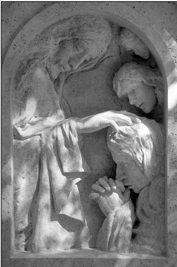
Hatalmat ad a bűnök bocsánatára