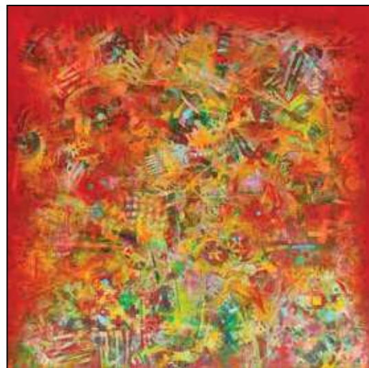
Tuzson-Berczeli Péter: Fragmentum historicum