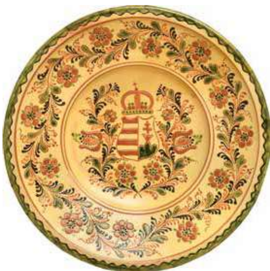
Sánta Márton: Címeres dísztál