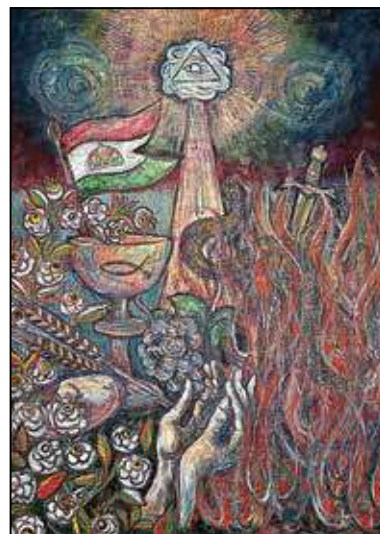
Homoki Gábor: „Szánd meg Isten a magyart”