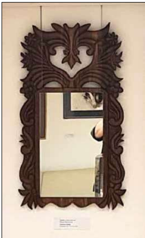
Török László: Tornyos tükör