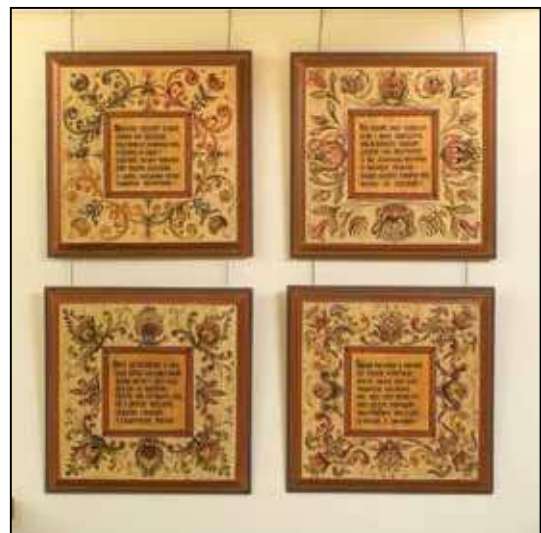
Székely Csilla: Nemzeti ima