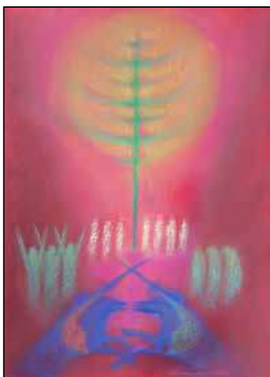
Gyurkovics Hunor: Himnusz