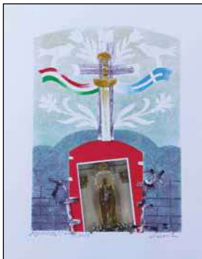
Sárosi Csaba: Himnusz