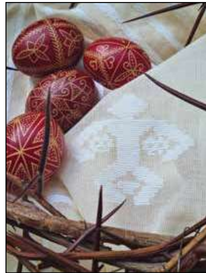
Jókainé Gombosi Beatrix: Festett hímes tojások (részlet)