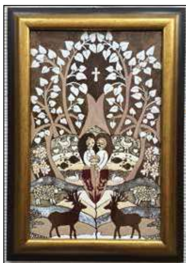
Stekly Zsuzsa: Himnusz – Dicsőítő hálaének