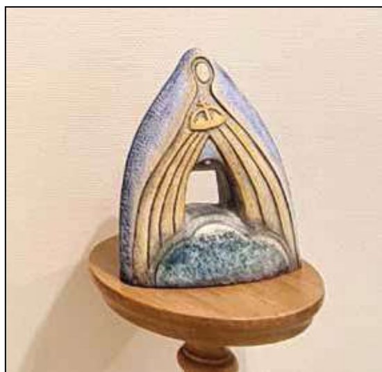
Nemes Fekete Edit: Áldd meg!