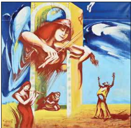
Kopócs Tibor: Psalmus