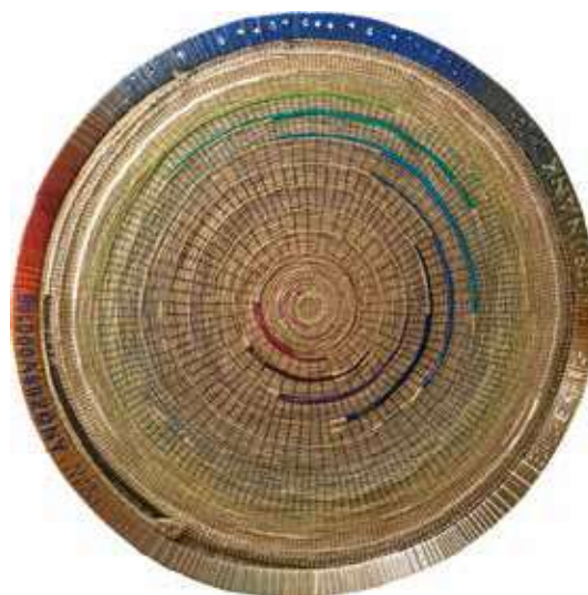
Orient Enikő: Évgyúrúink Himnusza