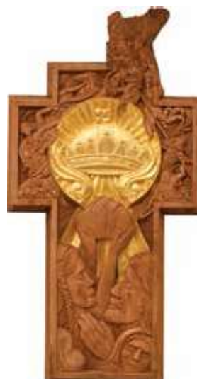
Smidt Róbert: Magyar Himnusz – Felajánlás és ima