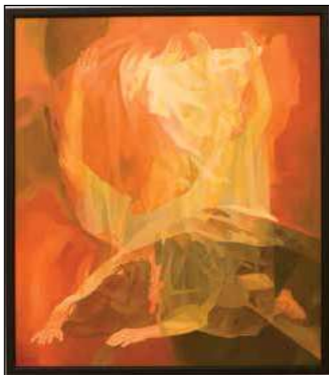
Xantusz Géza: Imánk