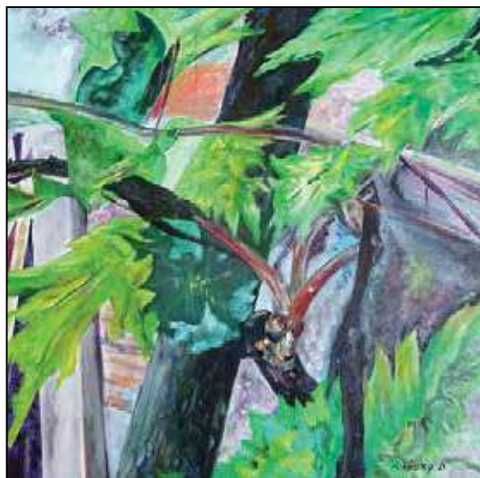
Mikóczy Dénes: Földtől az égig