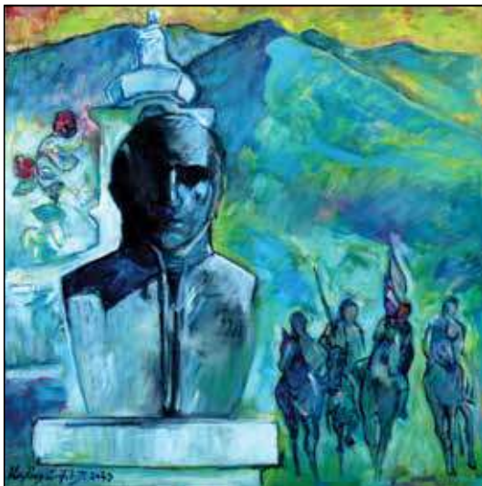
Kovács Emil Lajos: Himnusz