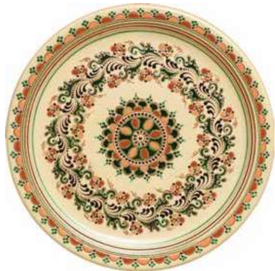
Kovács László: Tál