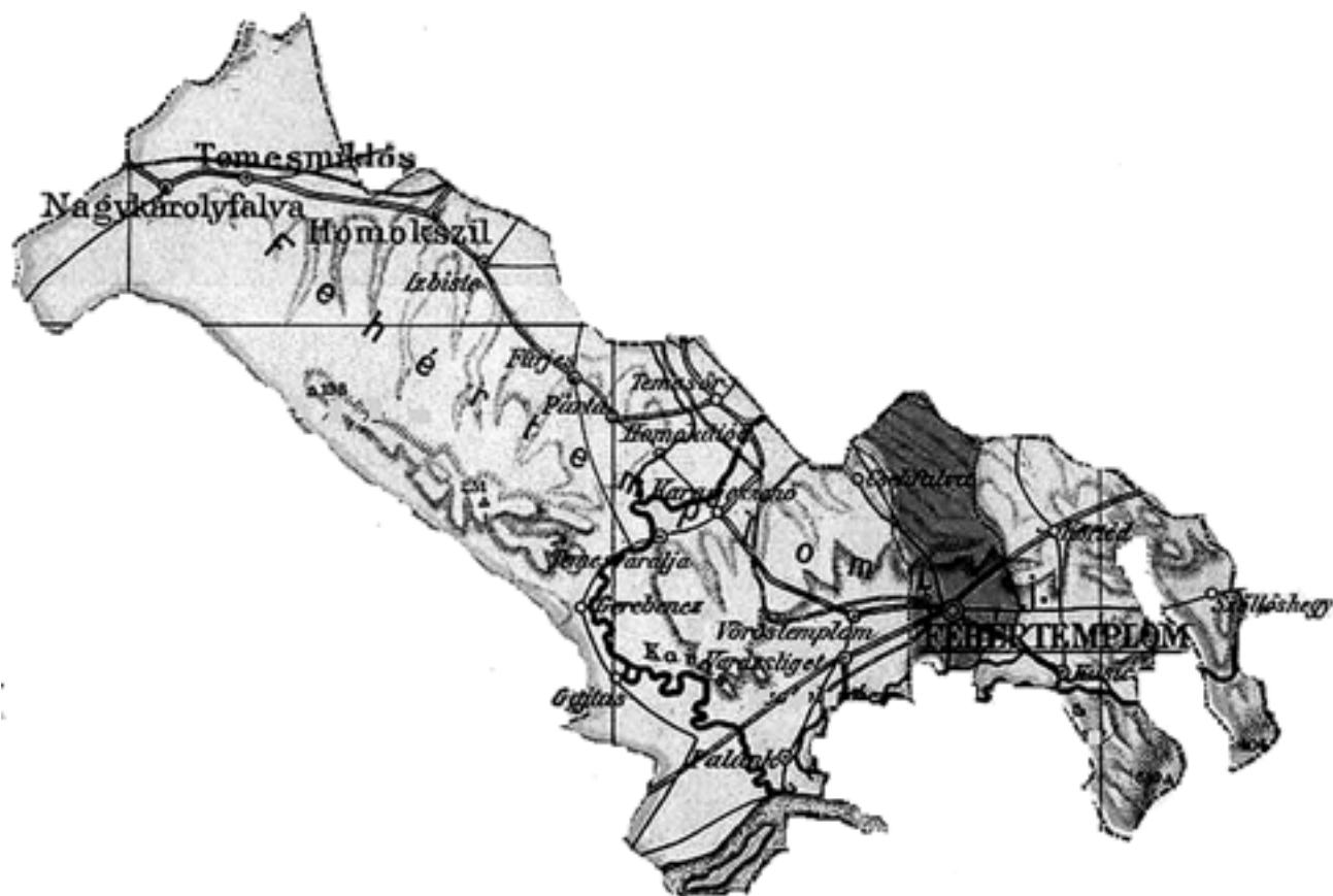
Az egykori Fehértemplomi járás és Fehértemplom rendezett tanácsú város térképe

Forrás: KOGUTOWICZ MANÓ: Temes vármegye térképe . Kiadatott a vallás- és közoktatásügyi m. kir. Minister úr megbízásából. Kiadja a Magyar Földrajzi Intézet Rt., Budapest, 1905 – alapulvételével saját szerkesztés.