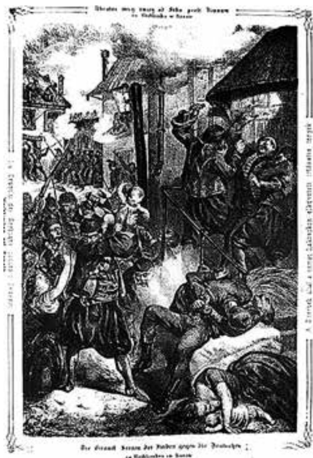
A fehértemplomi szerb vérengzés

Megjegyzés: Százhuszonöt kép az 1848–49-es európai forradalmak és szabadságharcok történetéből, amelyek Anton Ziegler Vaterländische Bilder-Chronik aus der Geschichte des Österreichischen Kaiserstaates című kiadványában jelentek meg 1850-ben Bécsben.